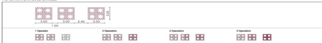
PROPOSTA D'IMPLANTACIÓ DE TERRASSES