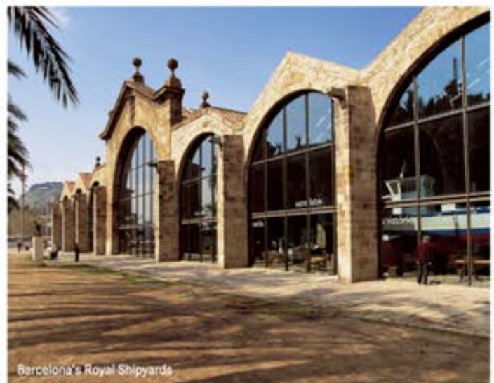
Barcelona's Royal Shipyards

El edificio, auténtica catedral de la industria naviera de 18.000 metros cuadrados, es una sucesión de naves góticas sobre pilares, que se han ido ampliando con el paso de los siglos y de acuerdo con las necesidades de la construcción de barcos. Son de especial interés el Pórtico Nuevo o de la llamada Sala de Comillas. El esplendor del interior de las atarazanas es capaz de transportarnos en el tiempo. Recorriendo sus salas llenas de reproducciones de barcos, cartografías o instrumentos de navegación podemos rememorar la estrecha relación que Barcelona siempre ha tenido con el mar. Todavía nos parecerá ver trabajar a los maestros carpinteros, veleros y calafates que dieron vida a estos muros en un pasado tampoco tan lejano y que ahora podemos revivir gracias al Museu Marítim.