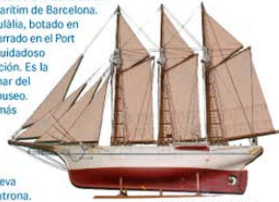
Schooner Santa Eulàlia

El pailebote Santa Eulàlia, botado en 1919, permanece amarrado en el Port Vell después de un cuidadoso proceso de restauración. Es la prolongación en el mar del fondo de piezas del museo. De hecho, es la obra más viva del museo. Se puede visitar y actúa de embajador de Barcelona, de quien lleva el nombre de la copatrona.