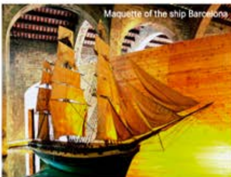
Maquette of the ship Barcelona

Les expedicions científiques i comercials entre Europa i Amèrica van obligar a la indústria naviliera a fer un esforç per millorar els vaixells. El Museu Marítim ens ho explica i ens mostra una extensa col·lecció de maquetes, sobretot, de la navegació atlàntica dels segles XVIII i XIX. Hi veiem navilis amb canons, fragates mercants, corbetes, bergantins, pollacres o goletes, sense oblidar els grans bucs transatlàntics de vapor, vitals per al transport massiu de passatgers.