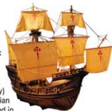
Maquette of the ship Victoria

Of particular interest is the gallery devoted to the era of discoveries (15th and 16th centuries), with the arrival of Columbus in America (the museum has models of the three caravels on display) or the first voyage round the world, begun by Ferdinand Magellan and concluded by Juan Sebastian Elcano (the museum has a maquette of the ship Victoria on display, the only one that succeeded in this great epopee). Visitors can refer to maps, instruments and charts to gain an understanding of the process which led to the opening up of the world, culminating in the 19th century with steam ships. Paintings, written texts and model ships show us, at first hand, the changes that took place in people's way of thinking and interpreting the world.