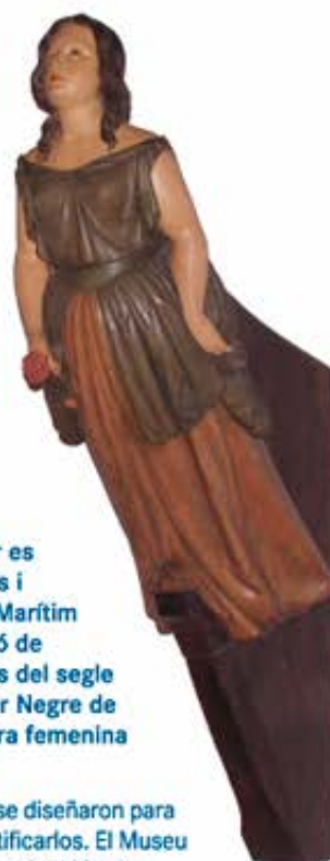
Figurehead: Dama de la rosa

Son obras de arte mágicas que primero se diseñaron para proteger los barcos y después para identificarlos. El Museu Marítim ha recuperado una importante colección de mascarones de proa de veleros catalanes del siglo XIX. Destacan la figura del guerrero Negro de la Riba, el del joven del Ninot o la figura femenina de la Blanca Aurora.