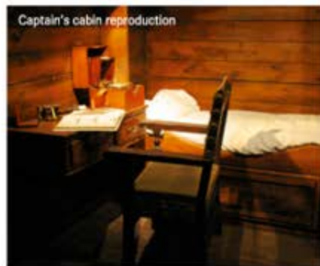
Captain's cabin reproduction

This is an area where we can all enjoy the thrills of the voyage, designed for young and old alike, for groups and individual visitors.