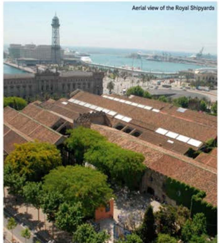
Aerial view of the Royal Shipyards

The building is a true cathedral of the shipping industry and covers a surface area of 18,000 square metres. It comprises a series of Gothic naves underpinned by pillars which have been extended as the centuries have gone by, in accordance with shipbuilding requirements. Of particular interest are the two-storey building known as the Porxo Nou and the Marquès de Comillas Hall. The splendid interior of the shipyards takes us back in time. As we move through its galleries, crammed with reproductions of ships, maps and navigation instruments, we are reminded of the close links Barcelona has always had with the sea. It is as though we can see the master carpenters, sailmakers and caulkers who brought this building to life in the not too distant past, which we can now relive thanks to the Museu Marítim.