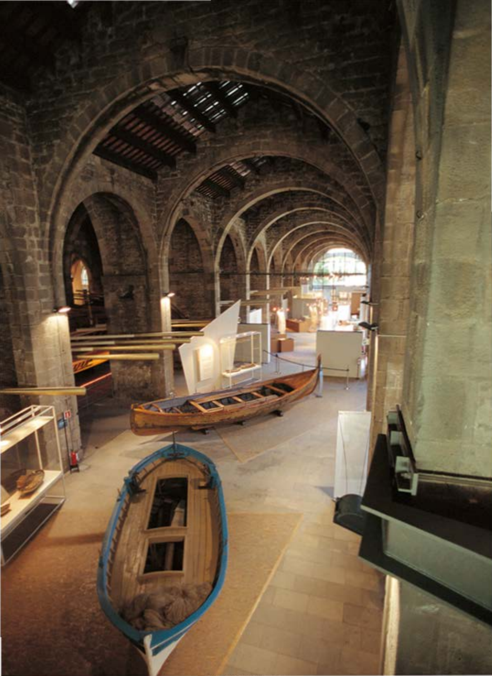
Museu Marítim de Barcelona