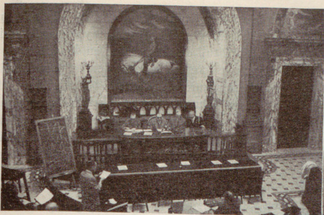
Dos aspectos de la Sala de Sesiones del Ayuntamiento de Valencia, donde se celebraban las Jornadas