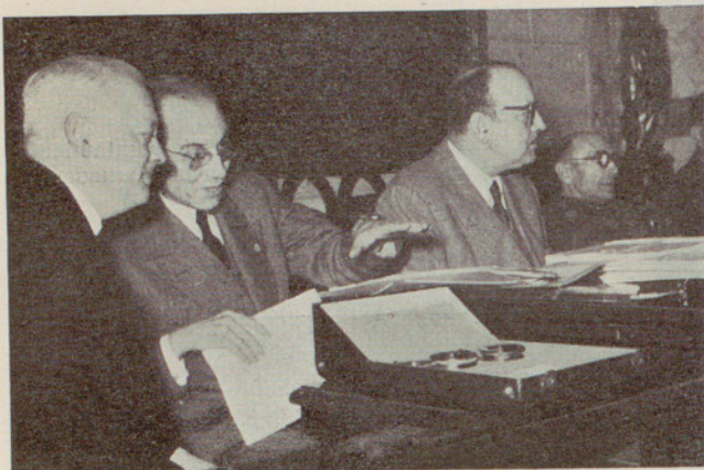
Los representantes del Ayuntamiento de Barcelona en las Jornadas Médicas Valencianas

bióticos, y cotejándolas con las otras regiones de España y del extranjero.