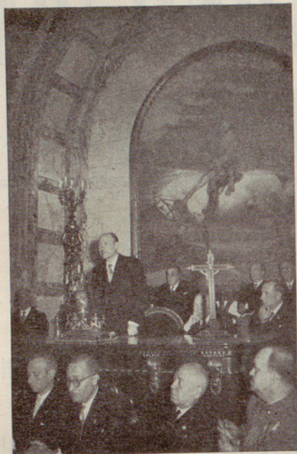
Discurso del señor Alcalde de Valencia en la sesión inaugural

cio del mencionado Hospital. De estas fichas, 2,300 corresponden a observaciones de fiebre tifoidea.