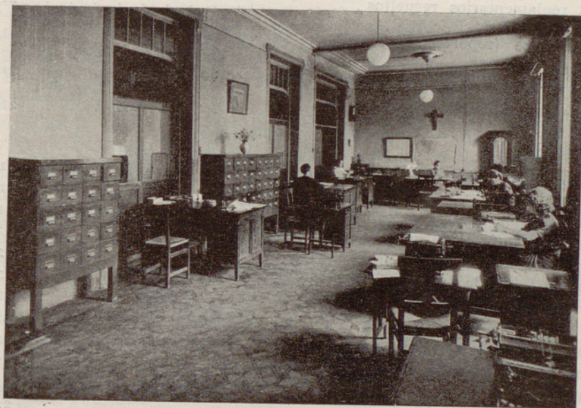
Dependencias de la Oficina Municipal de Matriculas