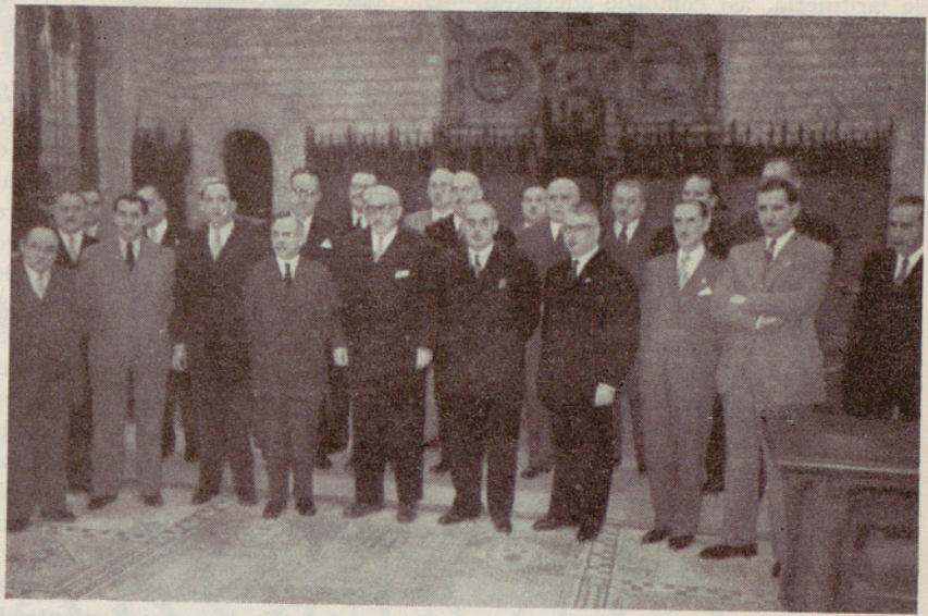
Los actuales representantes de la ciudad en el Salón de Ciento