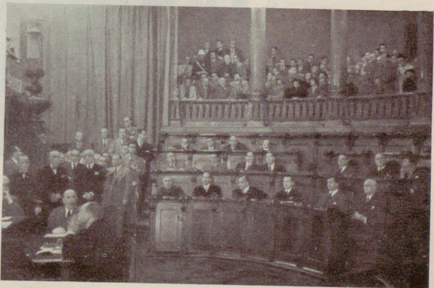
Aspecto del Salón de la Reina Regente durante el acto de constitución del nuevo Ayuntamiento