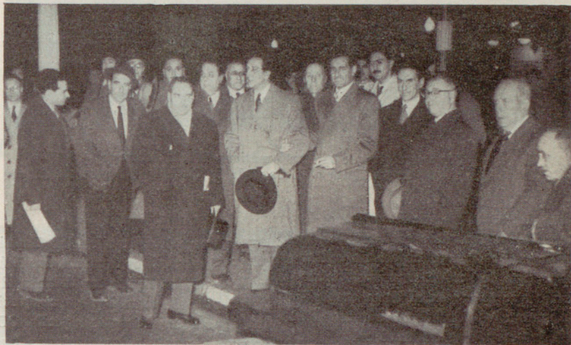
Inauguración de las señales de tráfico coordinadas en la vía Layetana

Así previsto, el tráfico en la vía Layetana se desarrollará en la forma siguiente: el pelotón de coches que, procedente de la avenida del Gene-