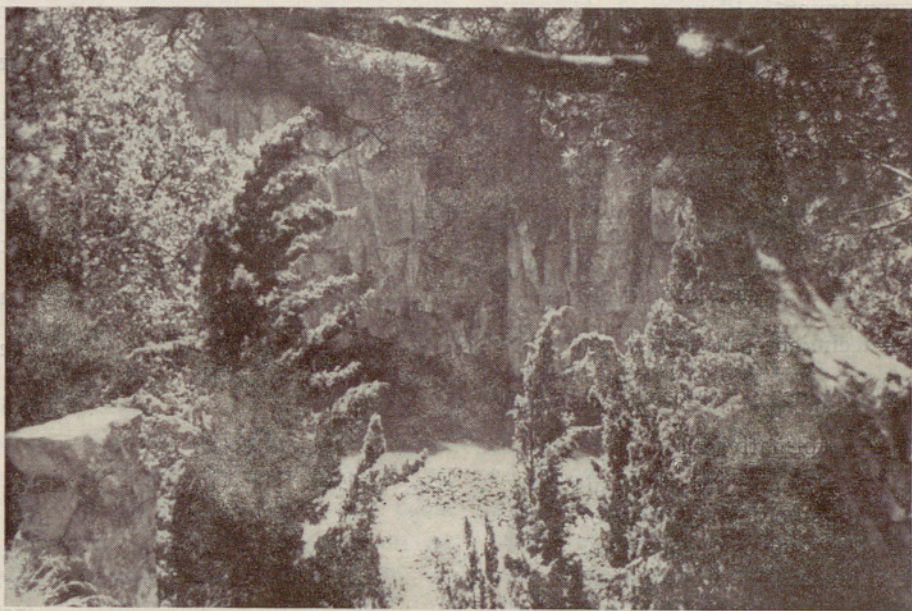
Rincón de Montjuich, digno de la paleta de un gran paisajista