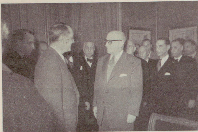
Los Directores de la Pan American World Airways en su visita a la Casa de la Ciudad

minadas, a las que debe sujetarse la elaboración del hielo en las fábricas a ello dedicadas, al objeto de evitar toda posible contaminación, tanto por lo que se refiere al agua empleada como a los depósitos o cámaras de refrigeración que se utilicen.