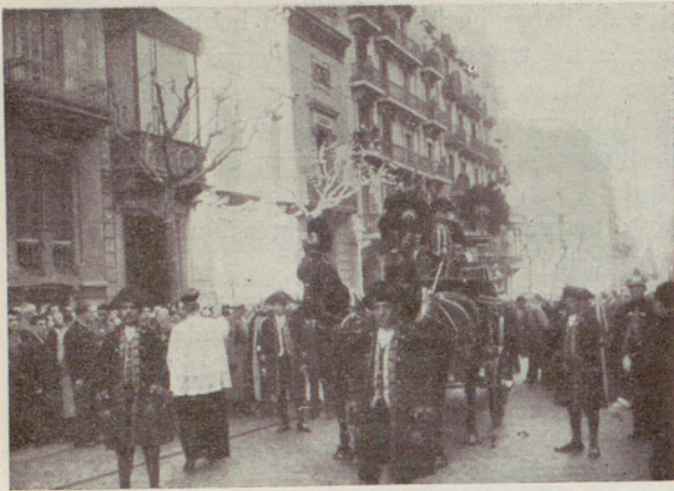
La carroza fúnebre

la Corporación municipal por la muerte del Barón de Terrades. También le dió cuenta del acuerdo de la Corporación de rendir al cadáver los postreros honores de Alcalde en funciones en el acto del sepelio.