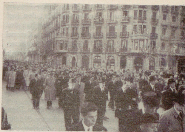
La presidencia familiar