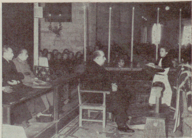
El excelentísimo señor Gobernador civil, don Felipe Acedo Colunga, en los funerales, representando al Gobierno

En el presbiterio, y al lado del Evangelio, ocupó