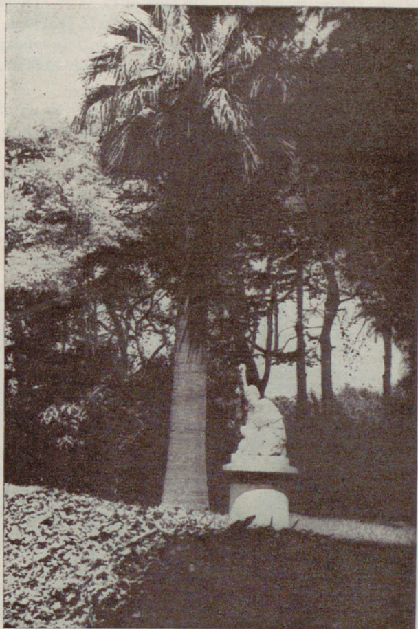
Un bello rincón del Parque de la Ciudadela