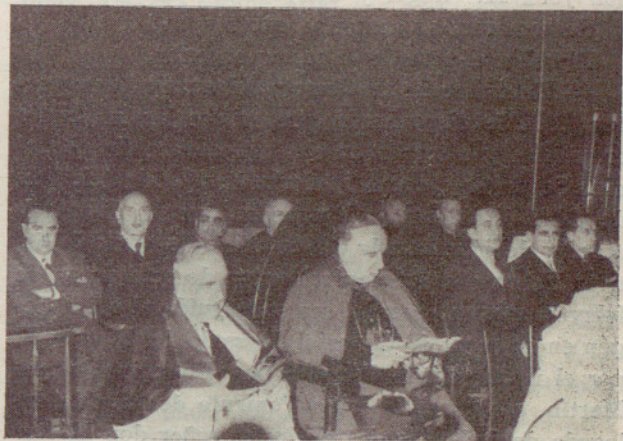
El señor Obispo y la representación municipal durante las exequias

¡ En gloria esté quien tanto amó a Barcelona !