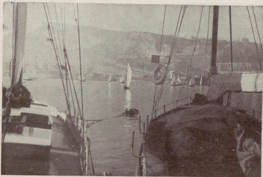
Mañana en el puerto de Barcelona. En el fondo la perspectiva, a media montaña de Montjuich, del paseo en construcción