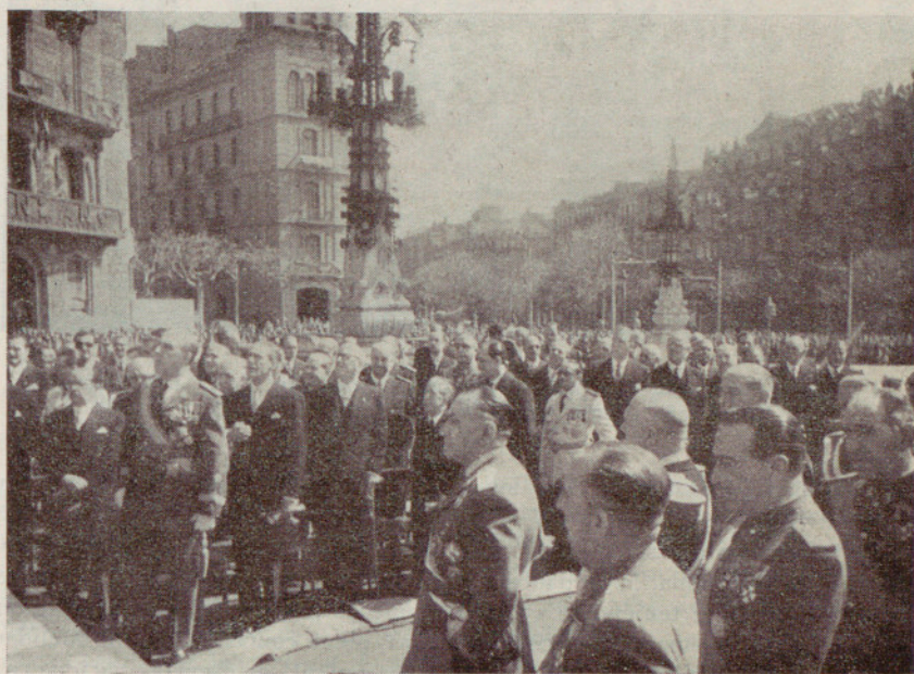
Las autoridades durante la misa del Día de la Victoria