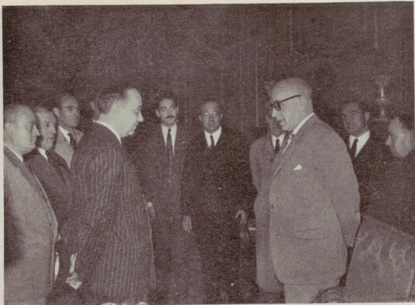
La representación de la Federación Catalana de Fútbol y de las entidades hortenses complimentan al excelentísimo señor Alcalde para agradecer el acuerdo municipal de adquisición del campo de deportes de Horta