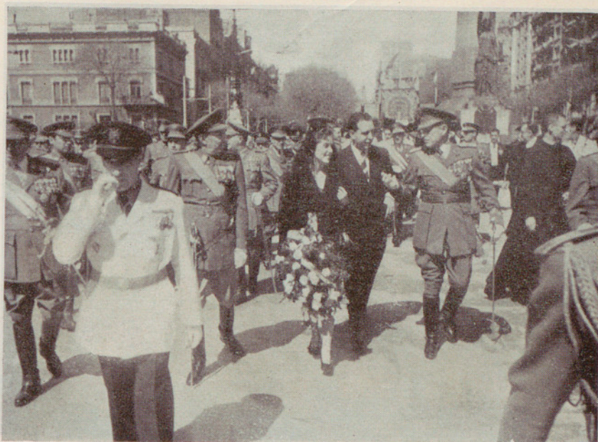
Terminada la misa del Día de la Victoria, las personalidades asistentes se dirigen a las tribunas para presenciar el desfile de las fuerzas