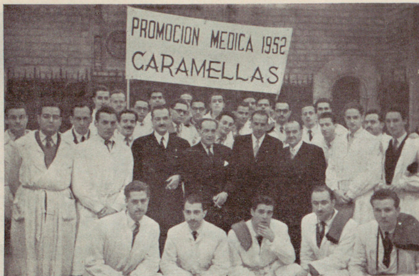
La «Caramella» de los médicos en el Salón de Ciento