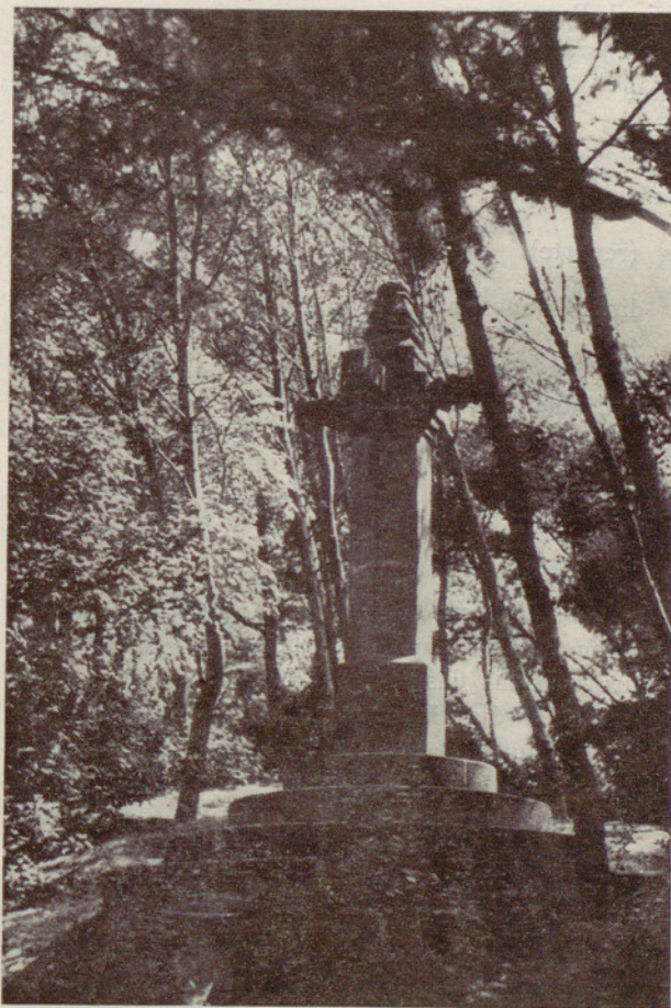
La cruz de término del Pueblo Español