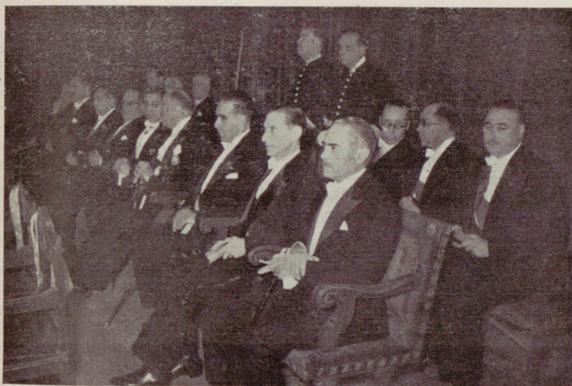
El Ayuntamiento en la Catedral, en los Días Santos