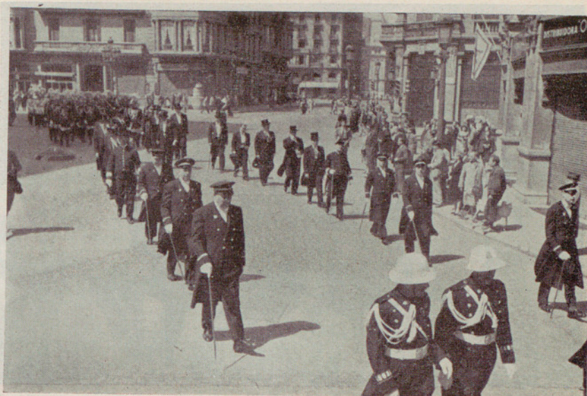
La Corporación municipal visita los Sagrarios de Semana Santa