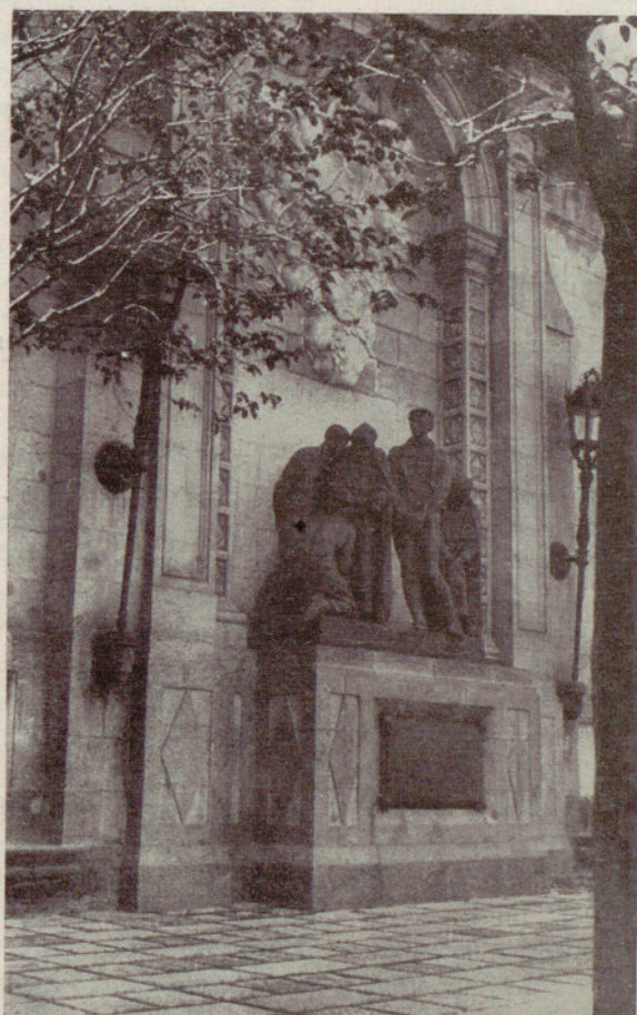
El monumento a los Mártires de 1809, con los nuevos elementos decorativos recientemente colocados