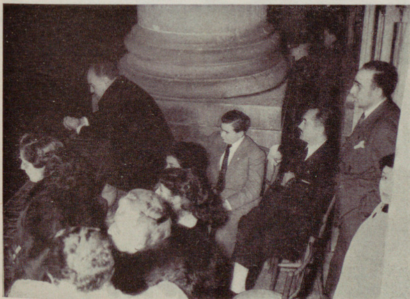
Personalidades presenciando el concurso de «Caramelles» desde el balcón de las Casas Consistoriales

DÍA 17. — Por la tarde, en el salón de actos de las oficinas centrales de