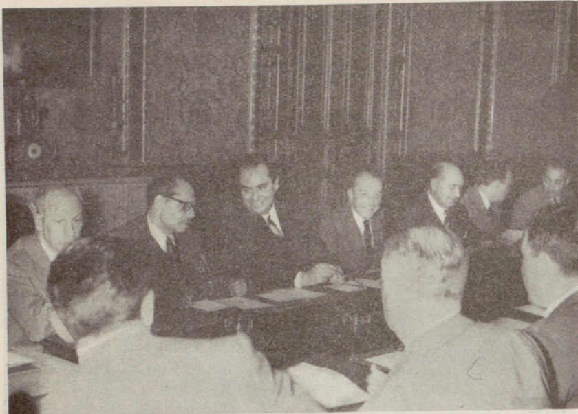
Un aspecto de la reunión del Comité organizador de los II Juegos del Mediterráneo