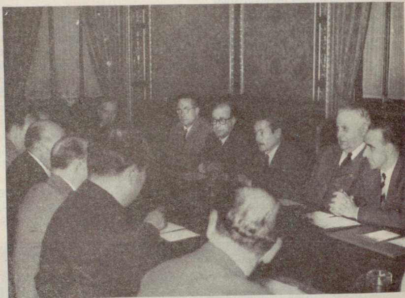
Presidencia de la reunión del Comité de los II Juegos del Mediterráneo

Durante la semana del 7 al 13 del corriente se registraron en Barcelona 297 nacimientos y 187 defunciones.