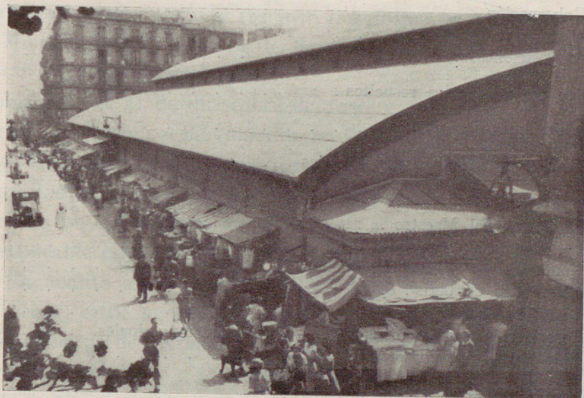
La animación del exterior del Mercado graciense de la Abacería Central