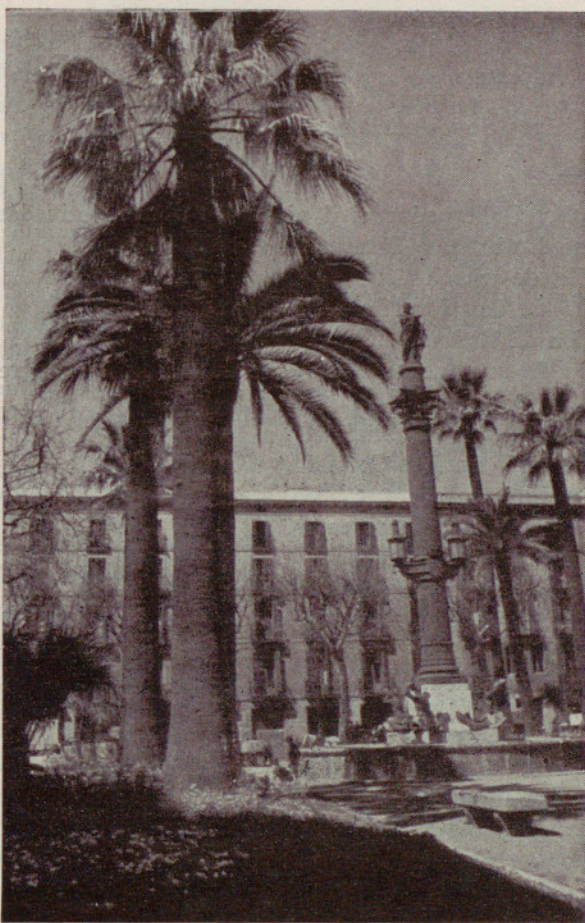
La plaza del Duque de Medinaceli, con el monumento al navegante Galcerán Marquet, una de las más finas y evocativas de la capital