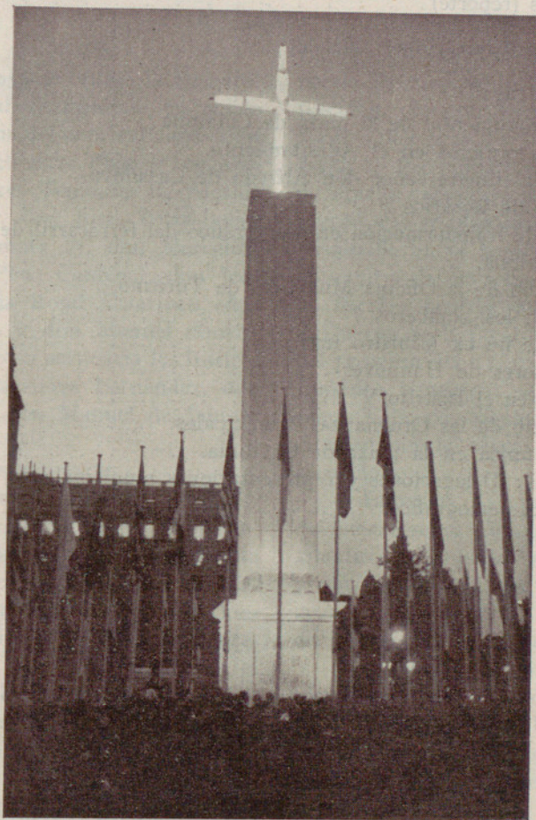
La Cruz monumental de la Plaza de Cataluña