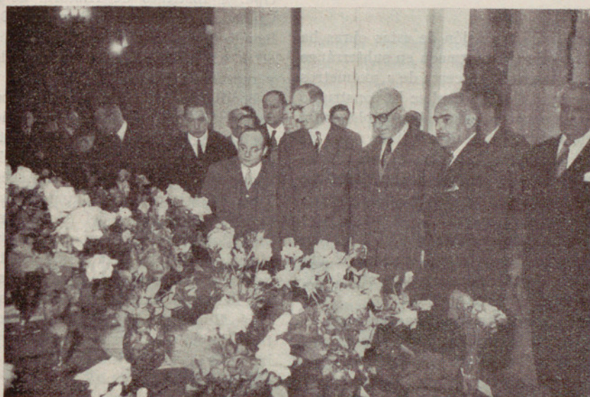
Las autoridades municipales recorriendo las instalaciones de la Exposición de Rosas en el Parque de la Ciudadela ←