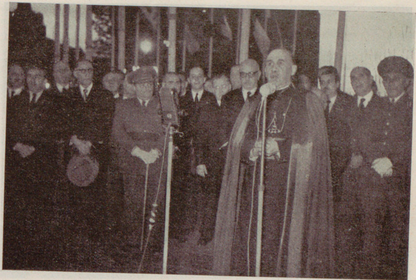
El ilustrísimo y reverendísimo señor Obispo, doctor don Gregorio Modrego, en la ceremonia inaugural de la Cruz de la Plaza de Cataluña

Al disponerse a dirigir la palabra al innumerable auditorio, el doctor Modrego fué calurosamente aplaudido por el público, y correspondió con su bendición a las ovaciones. Terminadas éstas, comenzó expresando su gratitud por la colaboración de las autoridades y del pueblo de Barcelona en el C. E. I. «Barcelona — manifestó — ha llenado al mundo de su nombre y de su empresa. Los millares de cartas que se reciben en el Congreso demuestran el entusiasmo congresista y la admiración por Barcelona». Dijo luego que nuestro Congreso será, entre todos los habidos, el que mayor número de extranjeros acoja. Este triunfo demuestra la pujanza de la ciudad y la fina sensibilidad con que sabe amar, creer y sentir. Se refirió