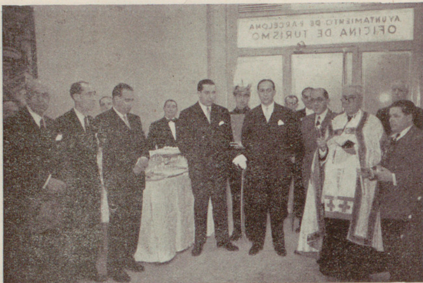
Un momento del acto inaugural de la Oficina Municipal de Turismo

últimos meses ha sido consagrada por entero a las obras del ferrocarril de Sarriá, se podrá emplear gran parte del material ferroviario de la actual explotación del ferrocarril que por su estado de conservación permita ser usado nuevamente para los túneles del Tibidabo, siendo de esperar que, en un plazo no superior a un año, pueda ponerse en explotación este ramal del Tibidabo, con la consiguiente mejora en las comunicaciones que se establecerán en la zona superior de la calle de Balmes con el centro de la ciudad.