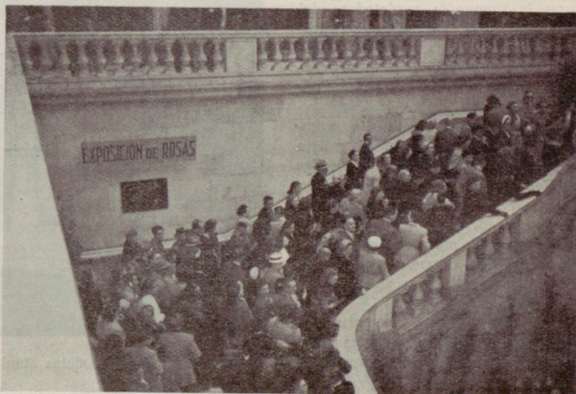
El público entrando en la Exposición de Rosas →