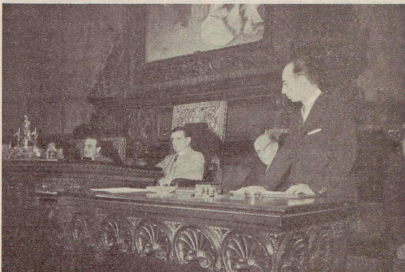
Clausura de la Semana Mundial de Publicidad en el Salón de la Reina Regente