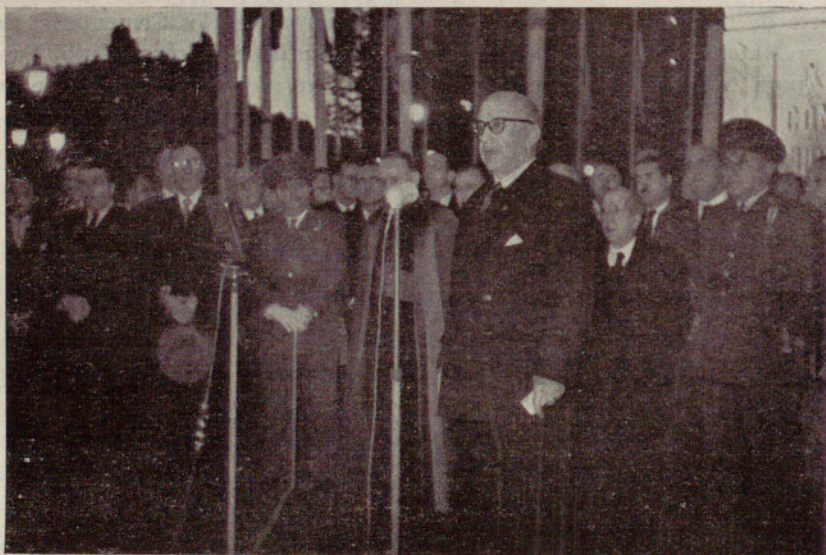
El excelentísimo señor Alcalde, don Antonio M. a Simarro, hablando en el acto preliminar del Congreso Eucarístico Internacional

«Dentro de pocos días va a comenzar el Congreso Eucarístico Internacional que todos esperamos. Es la segunda vez que a España se le confiere el honor de ser sede de un Con-