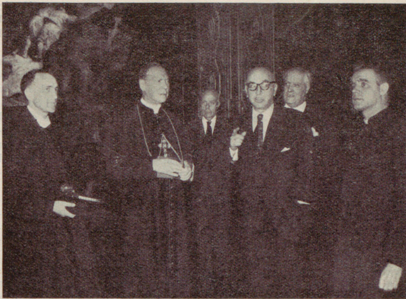
Visita del reverendísimo señor Alejandro Vachon, Arzobispo de Ottawa, al excelentísimo señor Alcalde de Barcelona

miento del público fué que queda establecida la dirección única en las calles siguientes, pertenecientes a la zona de influencia de la calle de Muntaner: