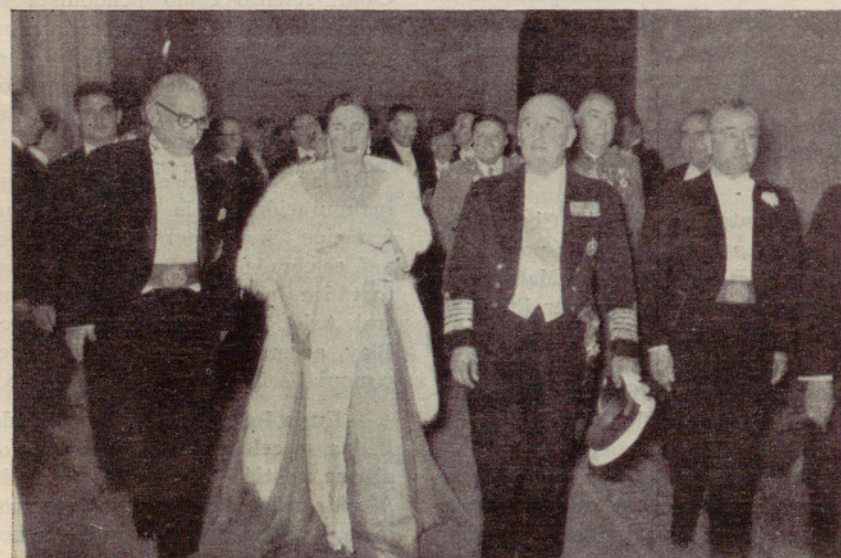
S. E. el Generalísimo y señora ascendiendo por la escalera de honor de la Casa de la Ciudad →