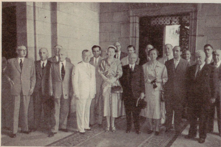
Los componentes del Comité Internacional de la Seda en su visita al Ayuntamiento