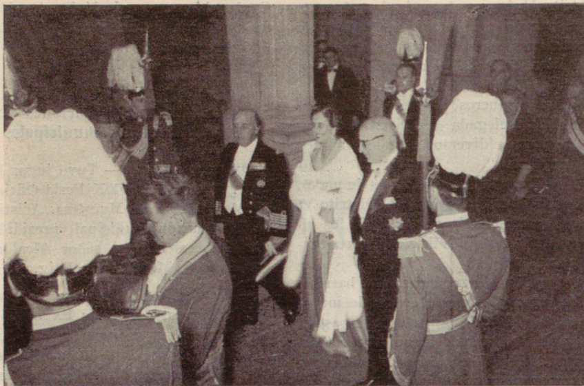
Llegada del Caudillo al Ayuntamiento ←