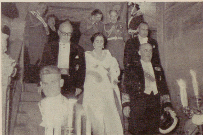
→ S. E. el Jefe del Estado y su egregia esposa al salir de las Casas Consistoriales