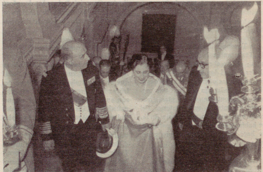
Otro momento de la presencia del Jefe del Estado en las Casas Consistoriales de Barcelona ←