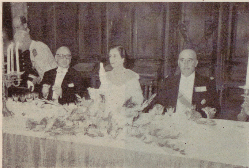
← Presidencia de la cena ofrecida a S. E. el Jefe del Estado en el Salón de Ciento