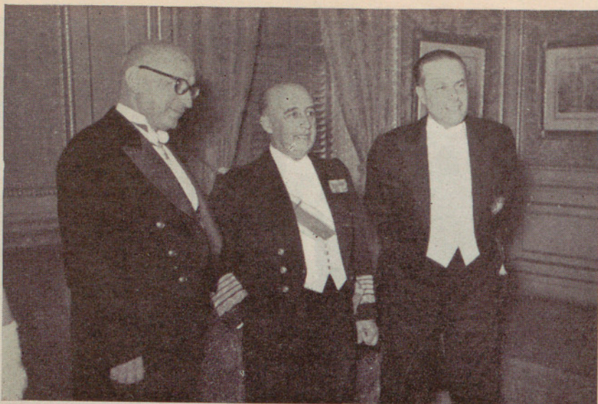
S. E. el Jefe del Estado, con los excelentísimos señores Ministro de la Gobernación y Alcalde de la Ciudad, en el despacho de la Alcaldía