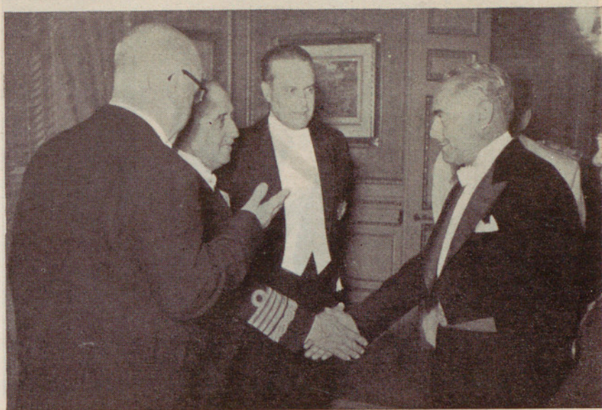
El ilustre señor Teniente de Alcalde don Antonino Segón Gay saludando al Generalísimo Franco →