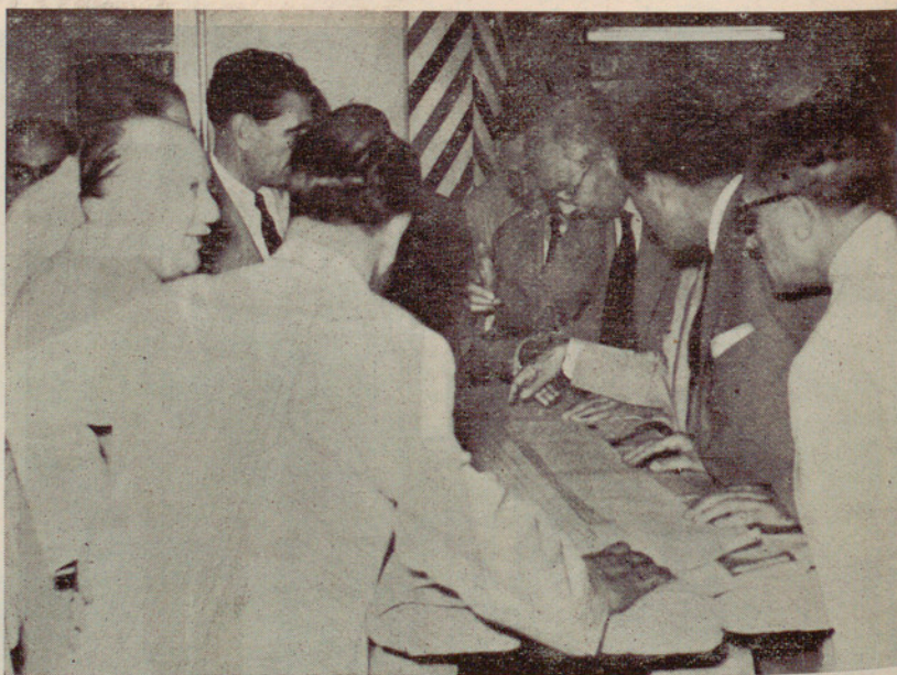
Examen de los planos que indican el trabajo que se realiza en el Metro Transversal en dirección al norte de la ciudad

DÍA 21 DE AGOSTO. — Al mediodía, el excelentísimo señor Alcalde acci-