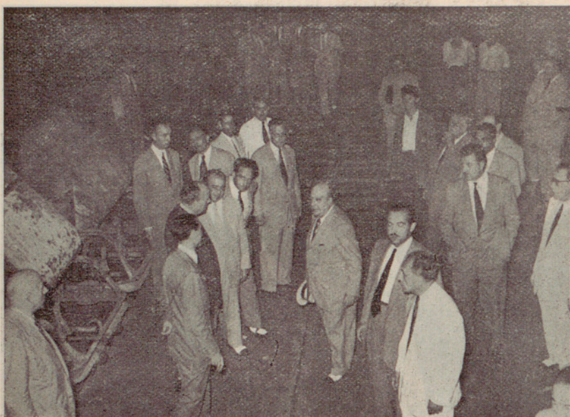
Visitando las obras de prolongación del Metro Transversal