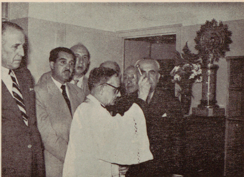
Un momento de la bendición de la nueva estafeta postal del Clot

Acto solemne entregar Ayuntamiento Estafeta Correos San Martín, asistencia autoridades, fuerzas vivas y corporaciones, le reitero sentida consideración. — Emilio Compte Pi, Teniente de Alcalde.»