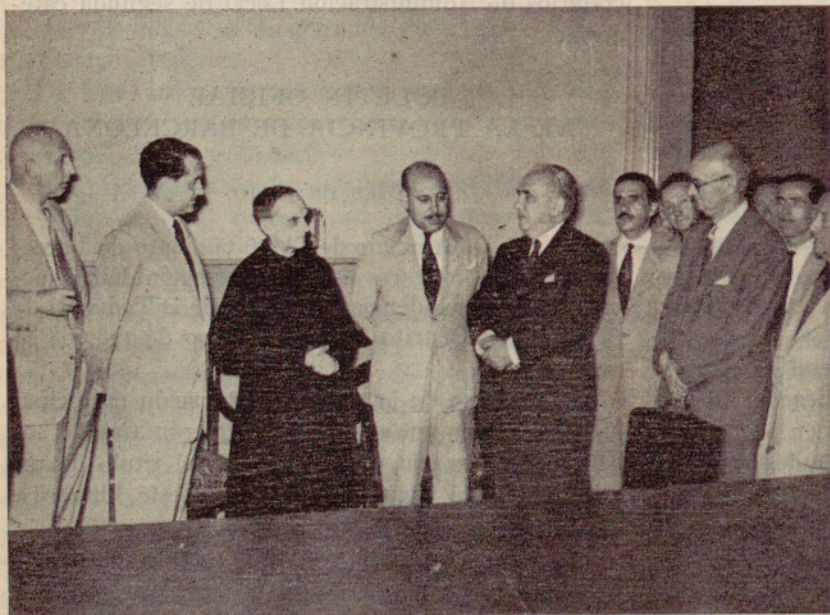
Acto inaugural de la estafeta de Correos sita en las ex Casas Consistoriales de San Martín de Provensals