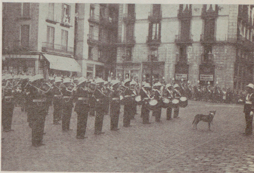
Un momento de la diana floreada de la Guardia Urbana, con la mascota al frente

En la Basílica parroquial de los Santos Justo y Pastor se celebró, a las diez y media, un solemne oficio,