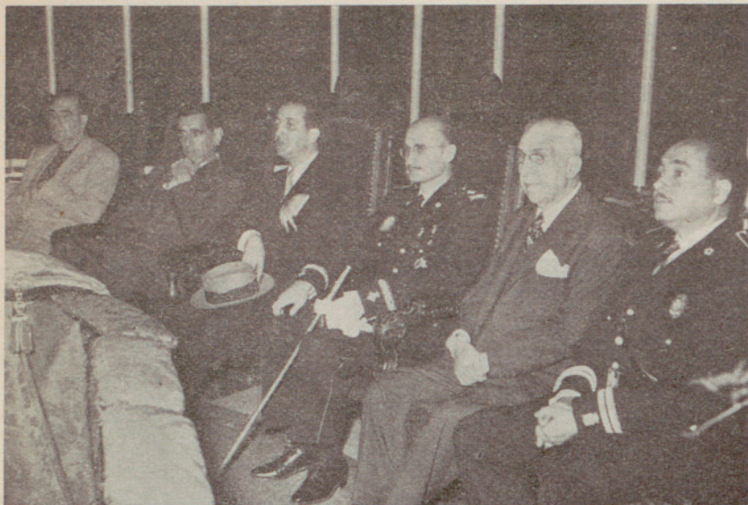
La presidencia del oficio celebrado con motivo del Día de la Guardia Urbana