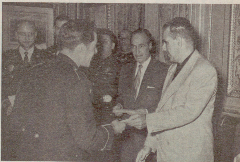
Entrega de premios a los guardias urbanos que más se han distinguido durante el año en el cumplimiento de su deber

Establecimientos comerciales. — Primer premio, Casa Hijos de V. Vinyolas. El segundo premio se divide entre la Casa Hijos de Francisco Sa-