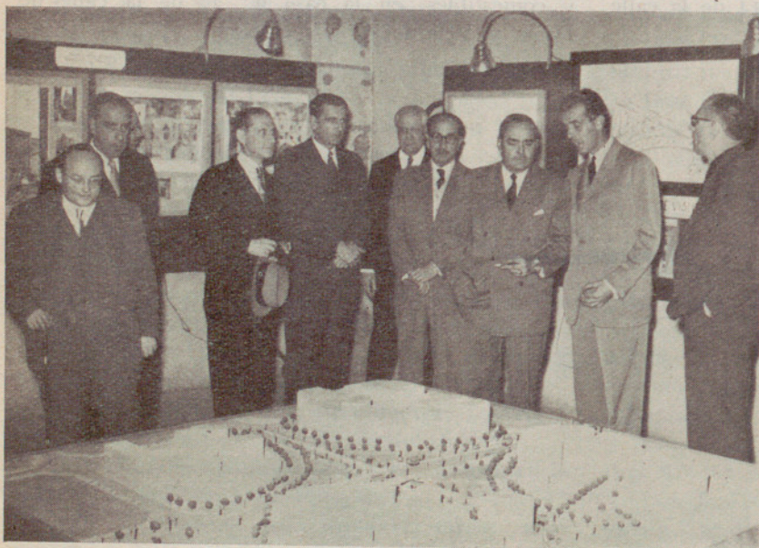
Acto inaugural de la Exposición de Proyectos municipales en el Palacio de la Virreina

Estuvo en el Ayuntamiento un grupo de alumnos de la Escuela de Artes y Oficios de Zaragoza, a los