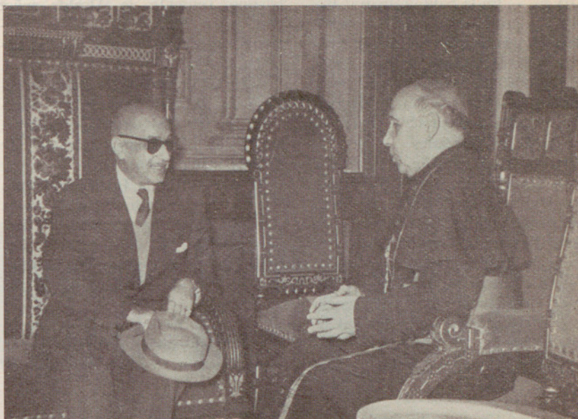
El excelentísimo señor Alcalde felicita, en el día de su onomástica, al excelentísimo y reverendísimo señor Arzobispo-Obispo de la diócesis

El movimiento turístico en las Oficinas municipales de Turismo e