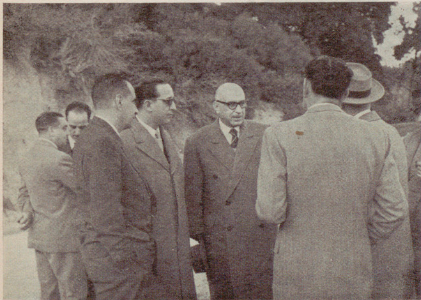
Un momento del acto inaugural de la pavimentación del paseo que conduce a Miramar

DÍA 23 DE OCTUBRE. — Con motivo del II Centenario de la Casa de Maternidad se celebró un solemne oficio de medio pontifical, bendición y colocación de la primera piedra del pabellón destinado a la Sección de Infancia, visita a los pabellones y dependencias, descubrimiento de la lápida conmemorativa de la celebración del XXXV Congreso Eucarístico Internacional e inauguración de la Exposición de gráficas, estadísticas,