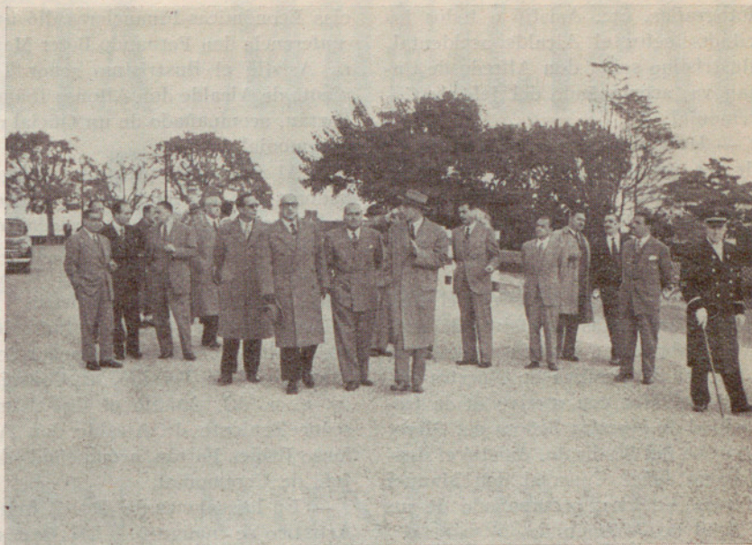
Estado en que queda el paso que del paseo de Colón conduce a Miramar, inaugurado por la Excm. Corporación municipal

Había sido habilitado el citado paseo provisionalmente durante la celebración del Congreso Eucarístico Internacional con el fin de descongestionar el tráfico rodado por la entrada de la exposición, y con el amplio acceso inaugurado, que tiene su arranque en la prolongación del paseo de Colón, se ha logrado establecer un doble enlace con Miramar y el Parque de Montjuich en ambos sentidos. Aparte la comodidad que en todos los aspectos representa disponer de una comunicación que canalice el tráfico ascendente de la zona portuaria, además del sistema de circunvalación que permite, de valor turístico ex-