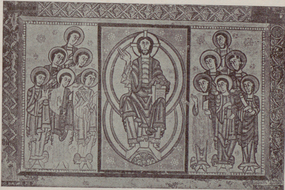
Museo de Arte de Cataluña : El Pantocrator, con los Apóstoles, procedente del Alto Urgel.