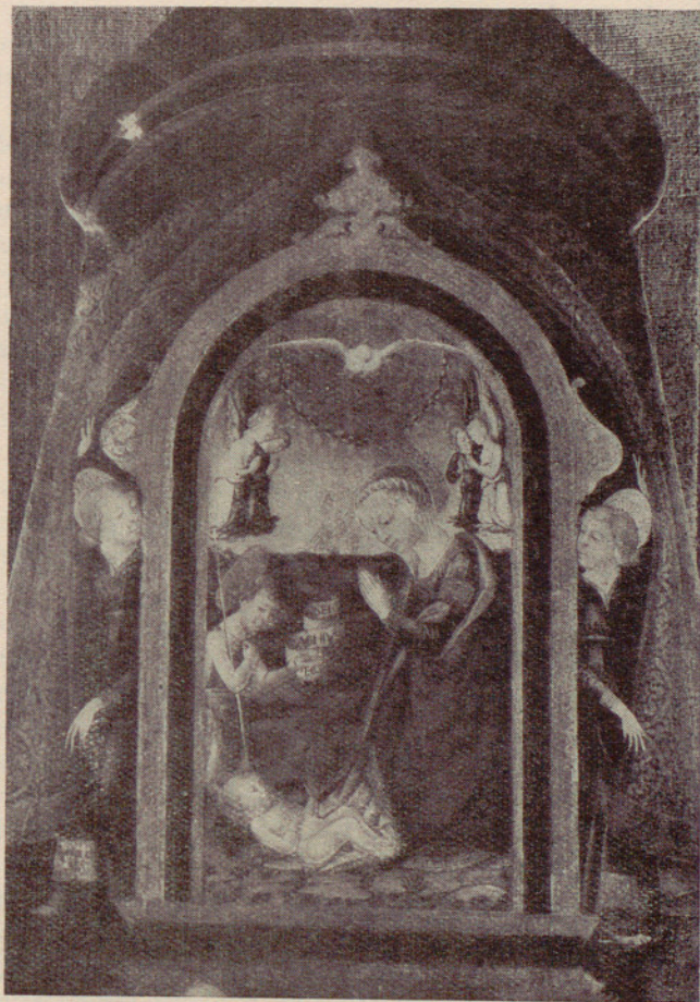
Legado Cambó : «La Virgen, el Niño y San Juan», por Neri di Bicci.