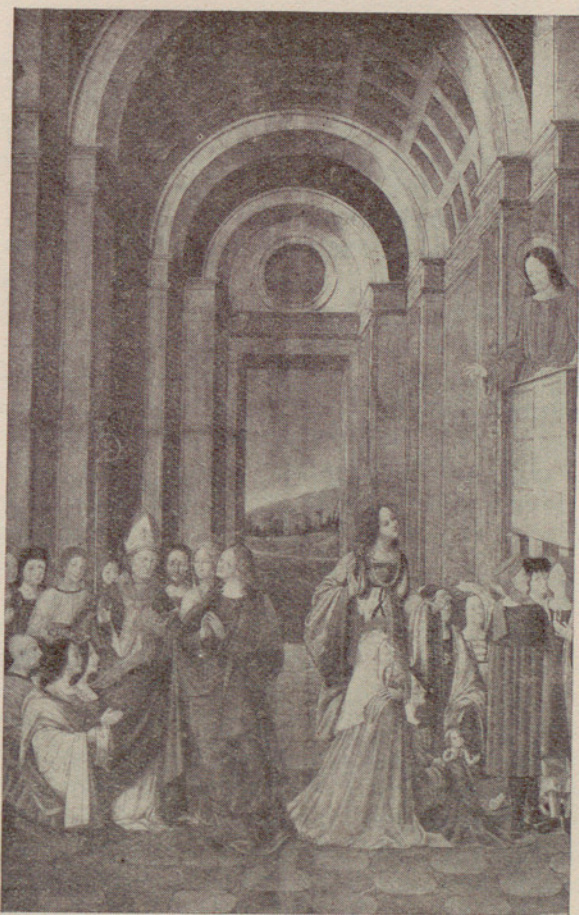
Legado Cambó : «Jesús predicando en el templo». (Escuela milanese, hacia 1500.)