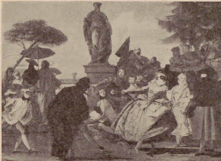
Legado Cambó : «El Minué», por Tiépolo.