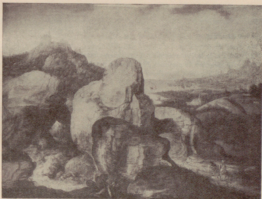
Legado Cambó : «La huída a Egipto», por Patimi (siglo XVI).