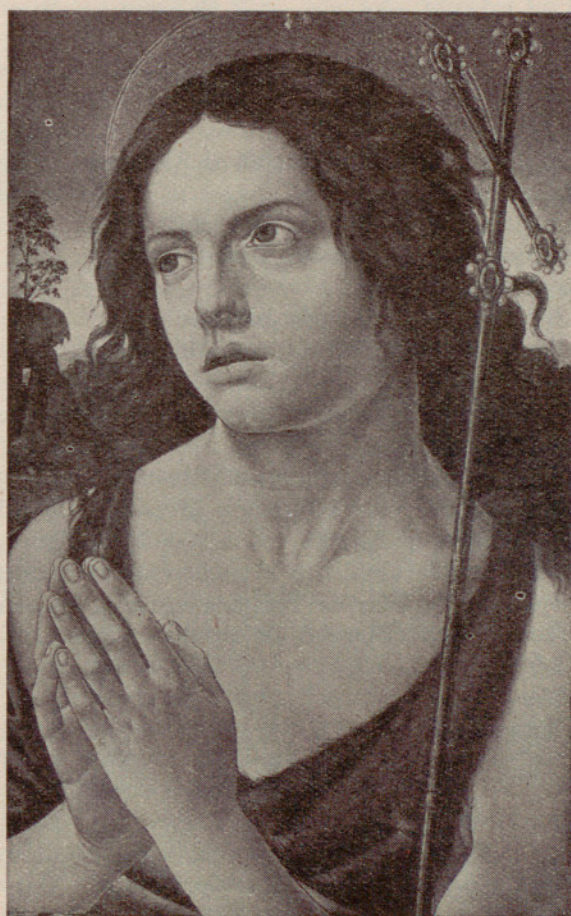
Legado Cambó : «San Juan Bautista», por Sandro Botticelli.