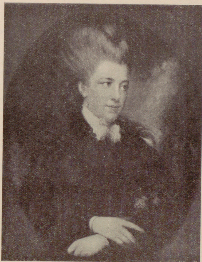
Legado Cambó : «Retrato de la Condesa Spencer», por Gainsborough.