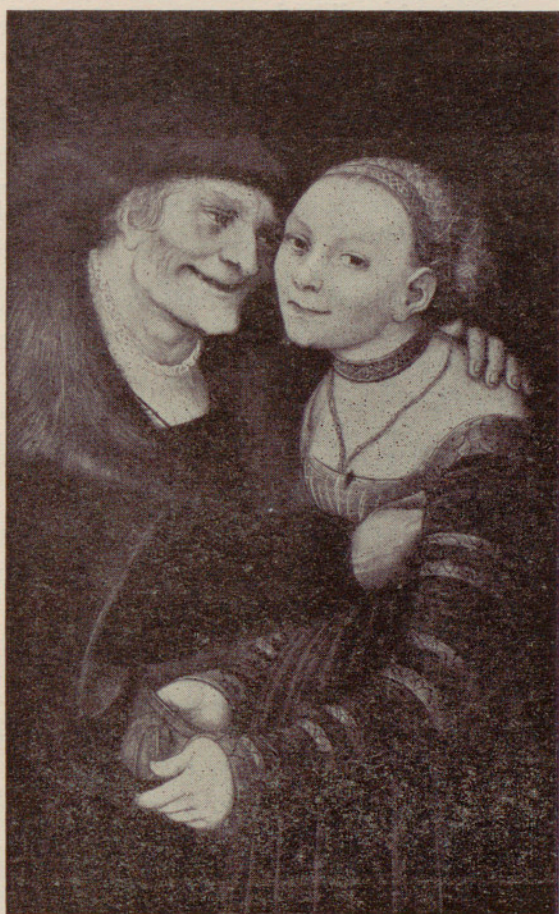
Legado Cambó : «Escena amorosa», por Lucas Cranach.