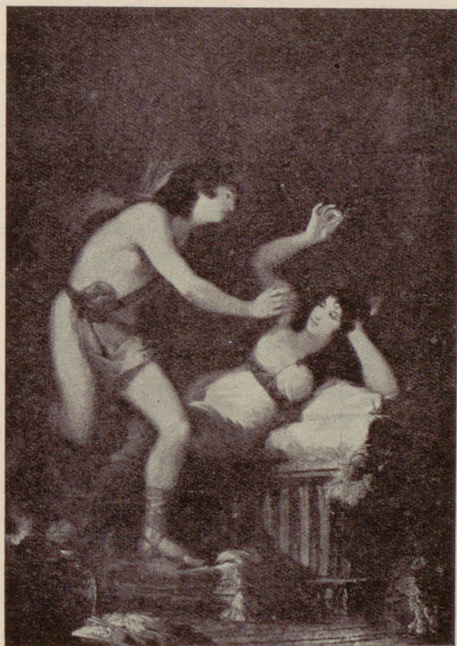
Legado Cambó : «Amor y Psiquis», por Goya.