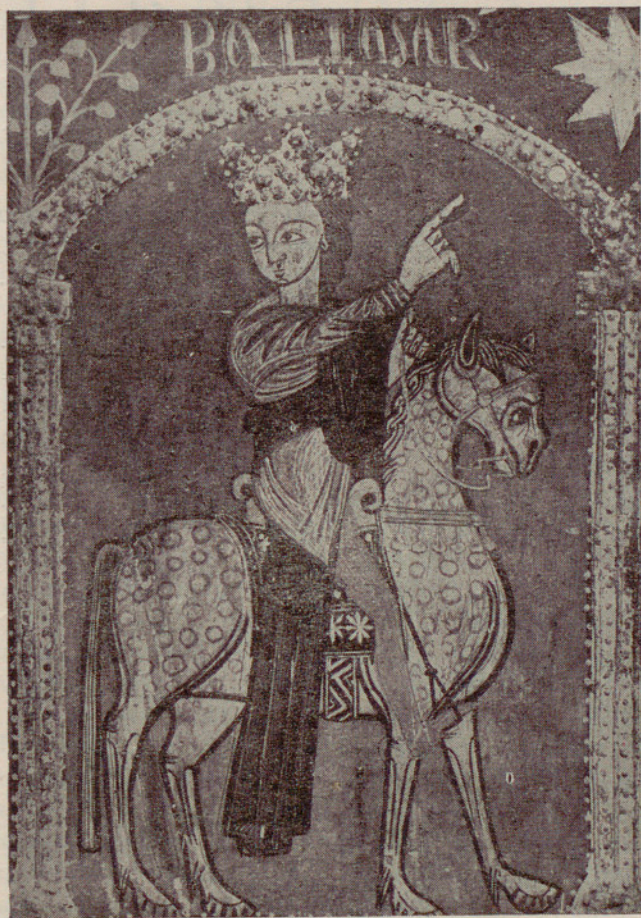
Museo de Arte de Cataluña : «Rey Baltasar» (siglo XIII).