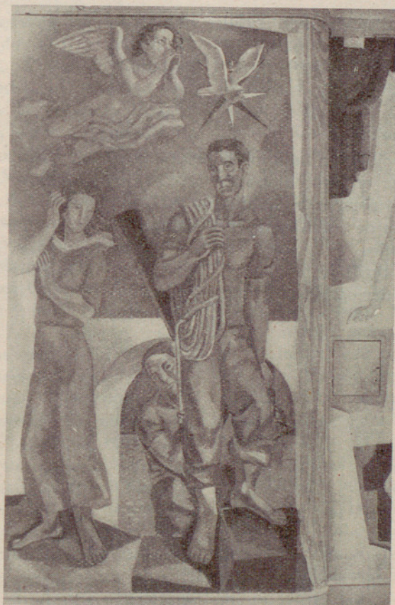
Escuela de Mar. Detalle de las pinturas murales de la Sala de Música, realizadas por el antiguo alumno Miguel Ibarz