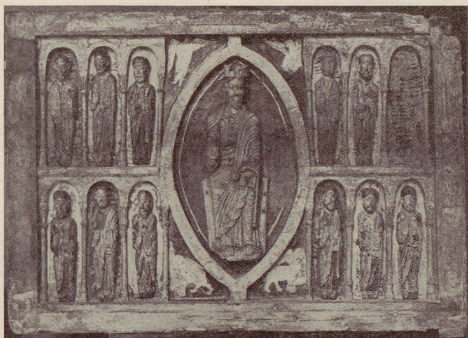
Museo de Arte de Cataluña : El frontal de Tahull (siglo XII).