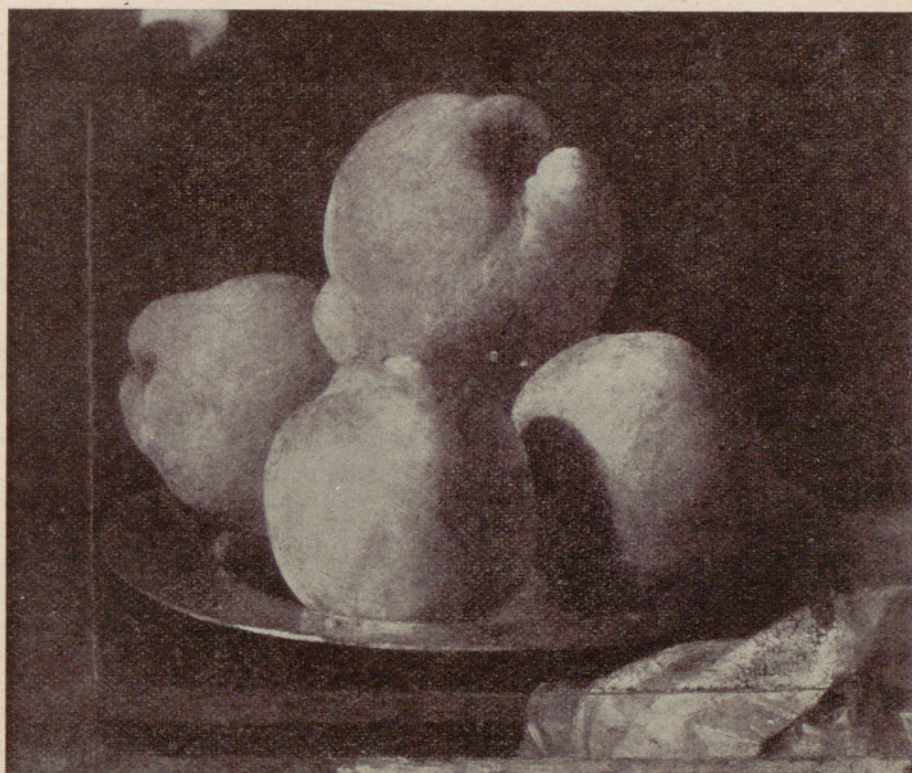
Museo de Arte de Cataluña: Un bodegón de Zurbarán.