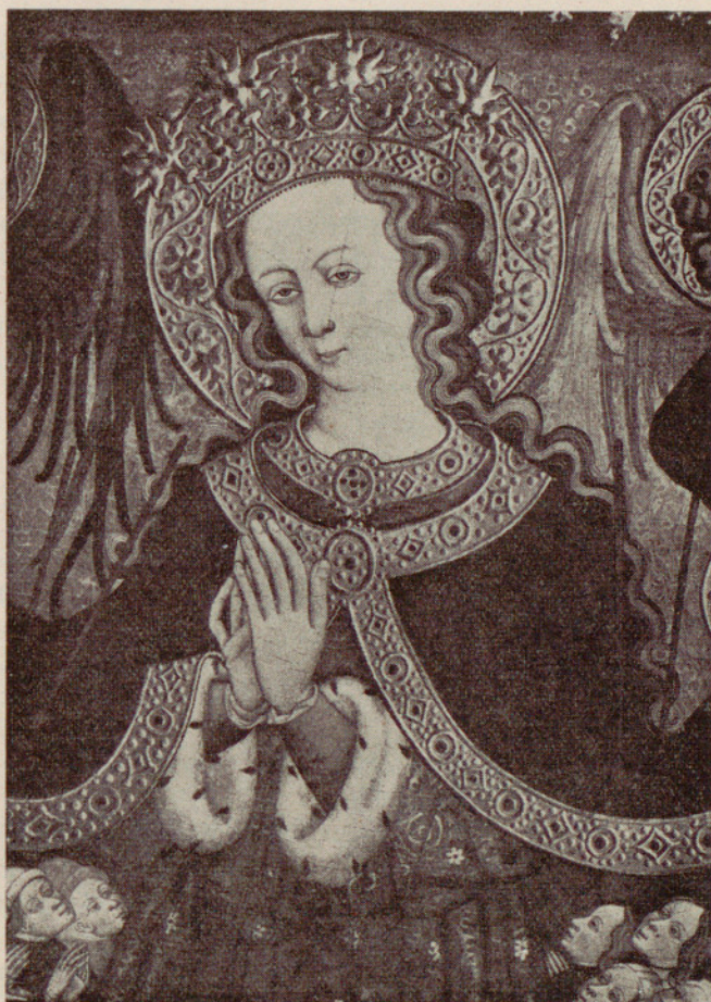
Museo de Arte de Cataluña : «Virgen de los Desamparados», del siglo xv.