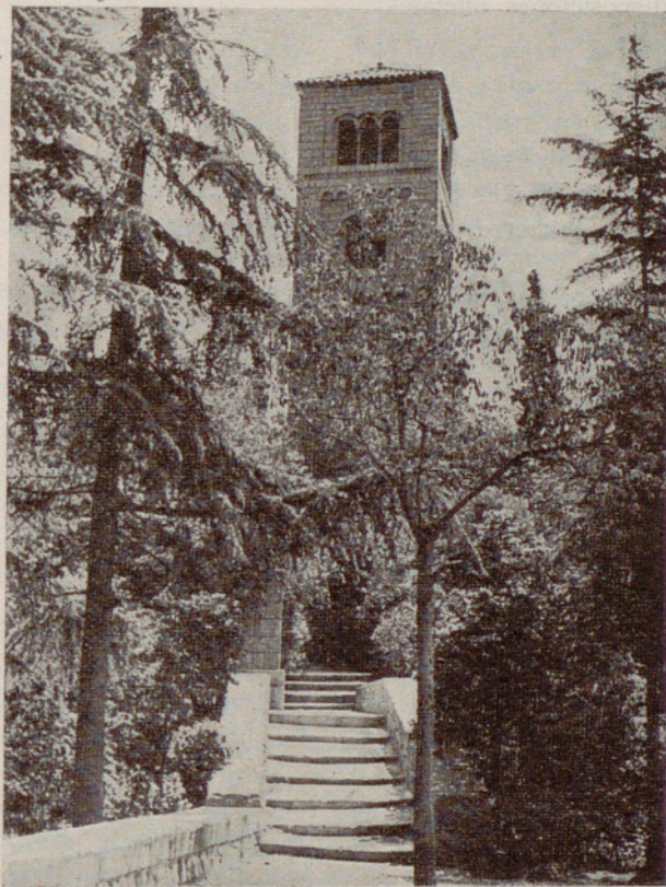
Una bella perspectiva, en el Parque de Montjuich