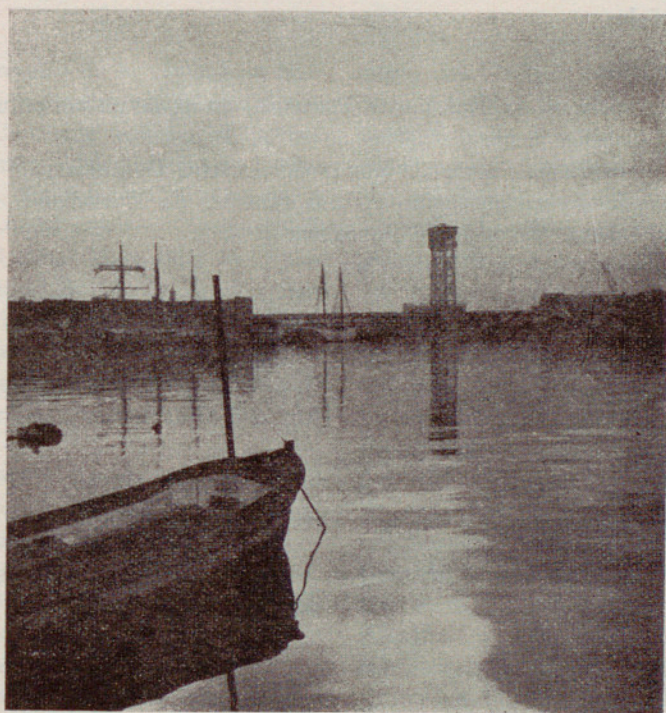
Perspectiva marítima barcelonesa, en un atardecer otoñal, donde la calma chicha dobla las figuras en la transparencia del agua.