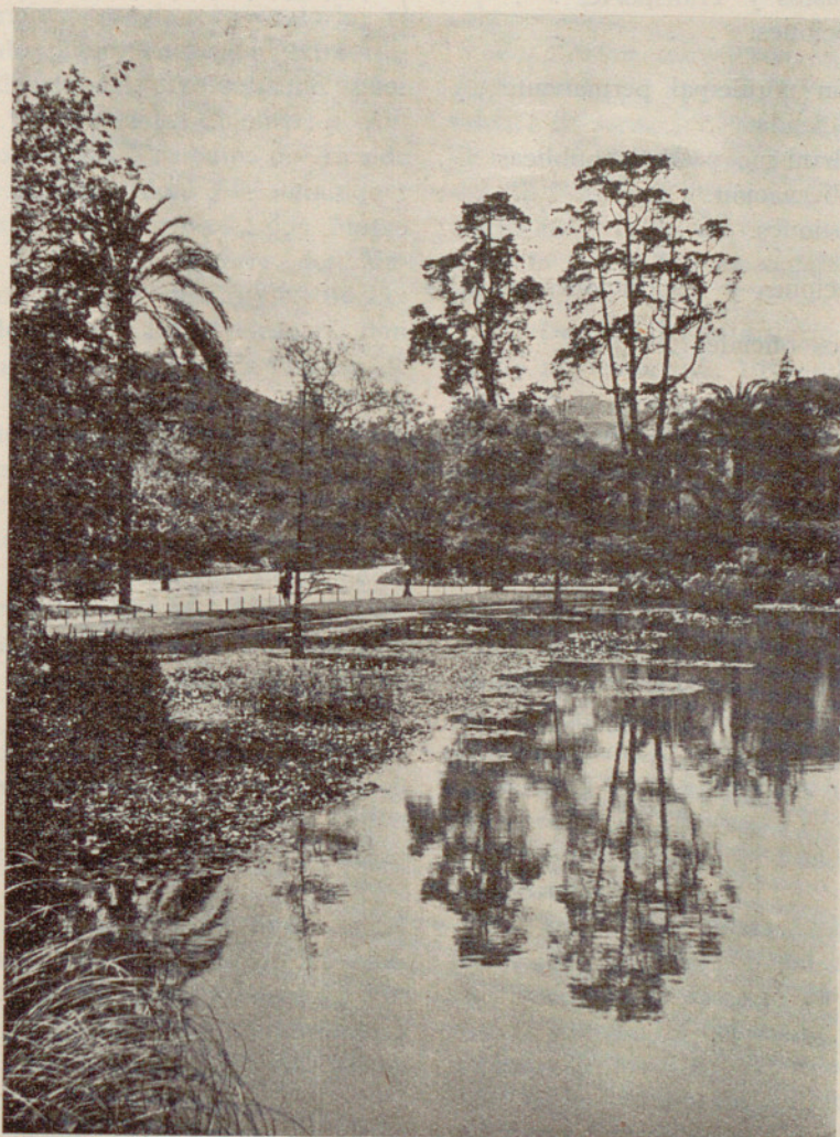
En el Parque de la Ciudadela pueden admirarse muchos rincones como éste de innegable sabor romántico.