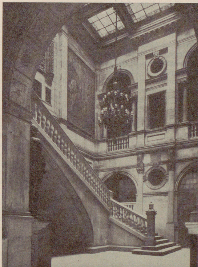
Escalera de honor en la Casa de la Ciudad, tal como quedó en 1929. A la izquierda se recorta la silueta de la magnífica escultura en bronce, de Llimona.