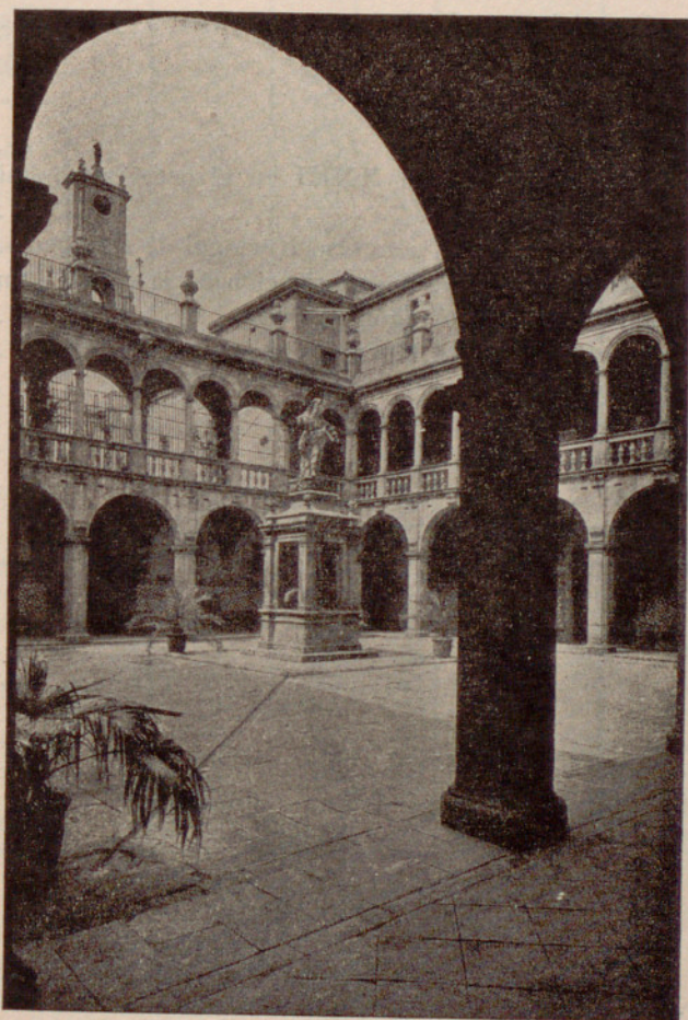
Artística y maravillosa perspectiva del patio de la Casa de Convalecencia (siglo xvii).