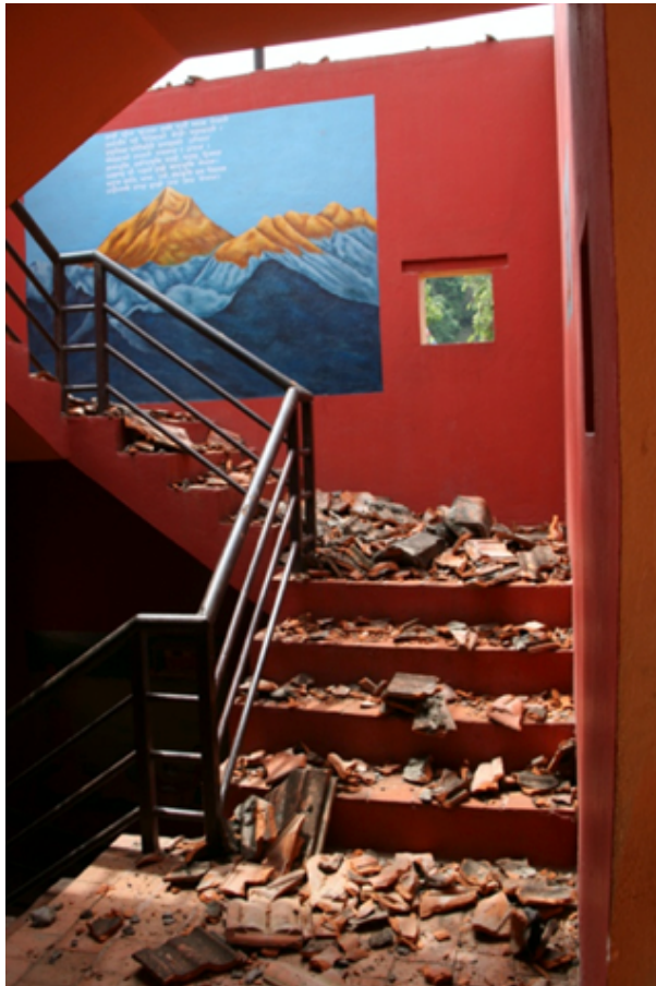
L'escola abans i després deñ terratrèmol