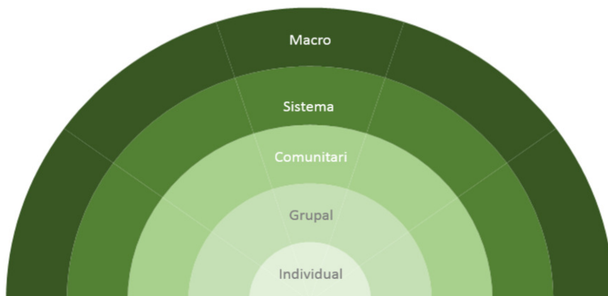
Figura 2 Nivells d'intervenció

Els 5 nivells estan relacionats entre ells. Per exemple, algunes polítiques actives destinen recursos econòmics a la implementació de programes actius d'ocupació que s'implementen a nivell grupal i en alguns casos també individual. El nivell sistema proporciona intervencions coordinades intersectorials que poden ser grupals i també individuals, d'una manera similar a les intervencions comunitàries que poden participar igualment del nivell sistema. En la Figura 2 s'observen els diferents nivells distribuïts en capes d'influència.