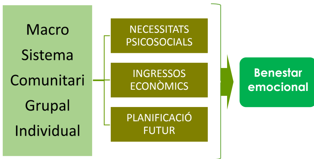
Figura 3. Marc per definir estratègies per millorar el benestar emocional de les persones en atur

A continuació es descriu per a cada nivell d'intervenció quines són les intervencions i les accions clau per desenvolupar-les. Les recomanacions estan basades i informades en l'evidència disponible en l'actualitat. Per a la seva elaboració s'ha realitzat una revisió narrativa de documentació. En l'annex 1 es resumeix l'evidència revisada.