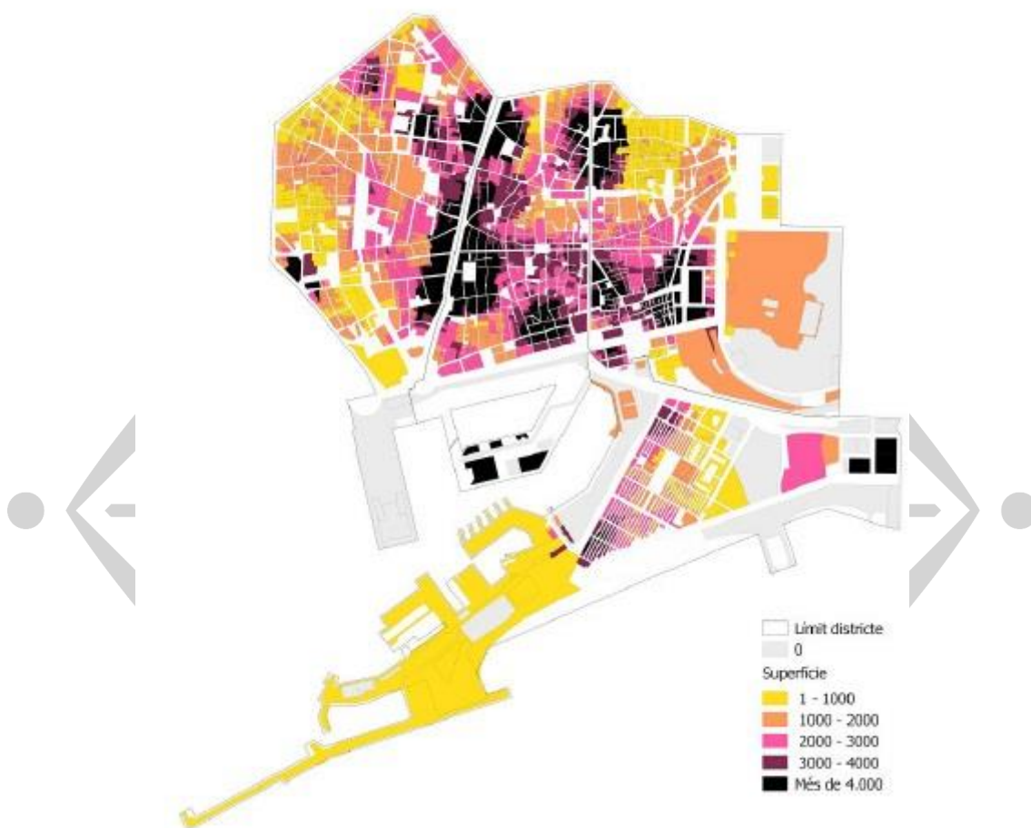
Plànol de saturació en radi 100m per epígrafs de nit en funció de la superfície.

D'aquí la importància de la creació de la figura dels BAIXOS DE PROTECCIÓ OFICIAL (BPO a partir d'ara) com una forma de protecció i de promoció dels usos econòmics i comunitaris d'interès ciutadà en el Districte. Els BPO representen una nova figura de les polítiques públiques municipals que modifica el paradigma de la relació de l'administració amb el comerç i les activitats econòmiques i que supera les polítiques promocionals i d'ajuts, ja que proposa l'activitat econòmica com un element central en la política contra l'expulsió dels veïns..