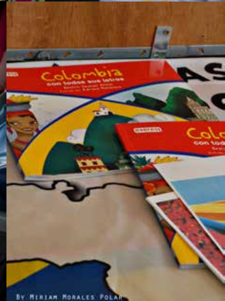
By MIRIAM MORALES POLAR