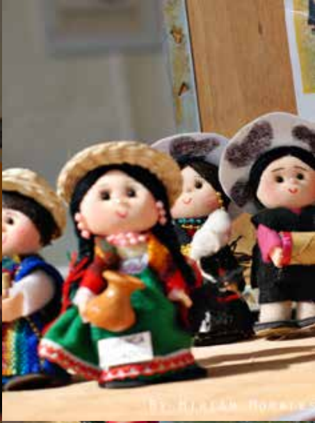
By MIRIAM MORALES POLAR