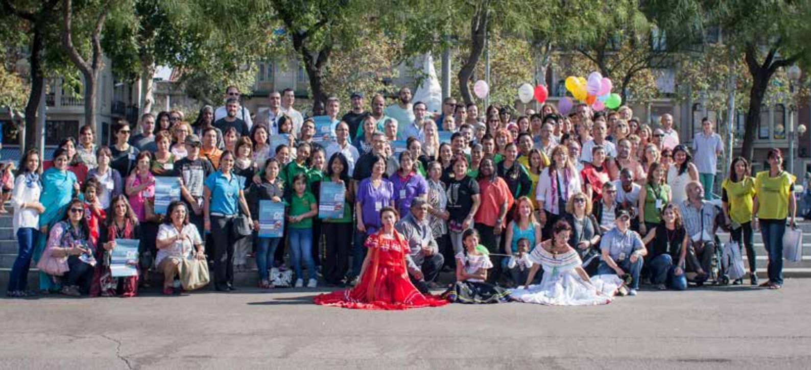
Foto de família de voluntaris i voluntàries