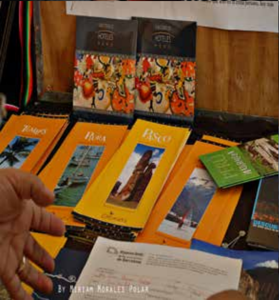
By MIRIAM MORALES POLAR