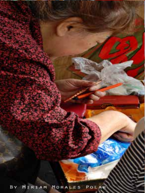
By MIRIAM MORALES POLAR