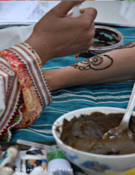
By MIRIAM MORALES POLAR