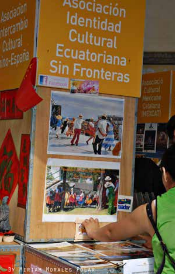
By MIRIAM MORALES POLAR