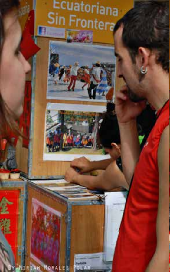
By MIRIAM MORALES POLAR