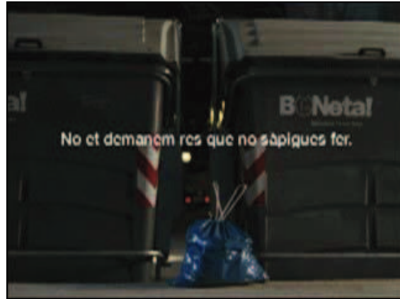
Fotogrames de l'anunci que s'emetrà per a la campanya de neteja amb el lema "No et demanem res que no sàpigues fer"