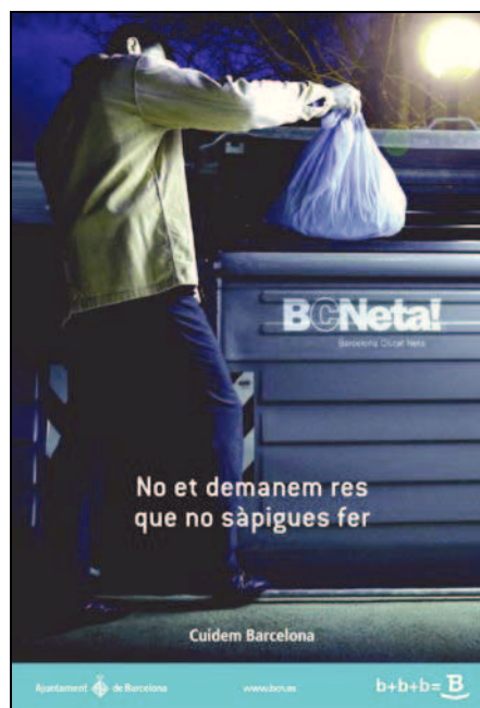
Imatge gràfica de la banderola que es veurà pels carrers

Actuacions a favor d'activitats que estimulin uns comportaments més cívics en l'àmbit de la mobilitat dels ciutadans.