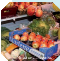
Mercat de Sant Antoni.