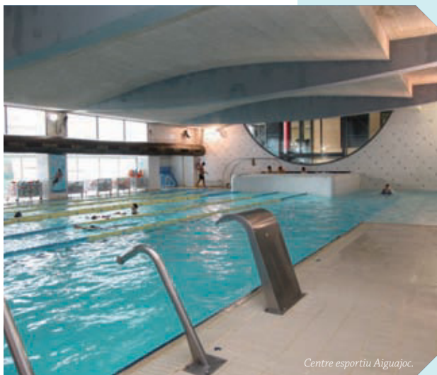
Centre esportiu Aiguajoc.