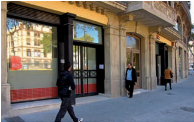
Façana del Centre de Serveis Socials de la Dreta de l'Eixample.

L'Ajuntament treballa perquè l'atenció social i sanitària sigui de la màxima qualitat i propera. Mostra d'aquesta aposta són el nou Centre d'Atenció Primària i el nou Centre de Serveis Socials a la Nova Esquerra de l'Eixample