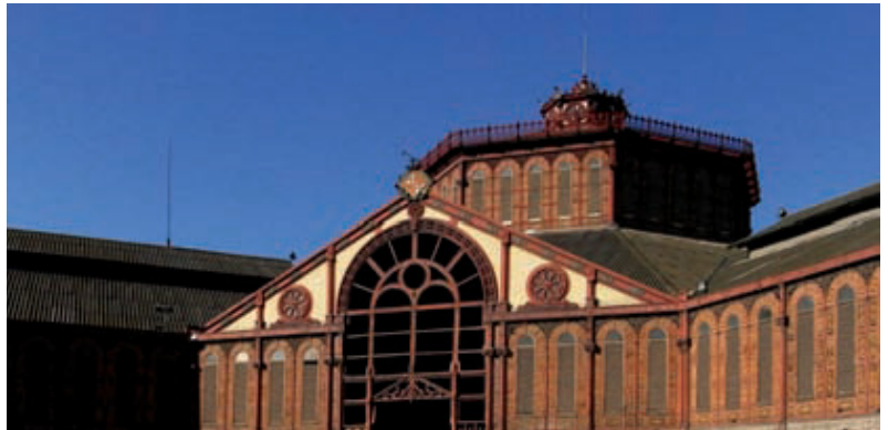
El mercat de Sant Antoni.