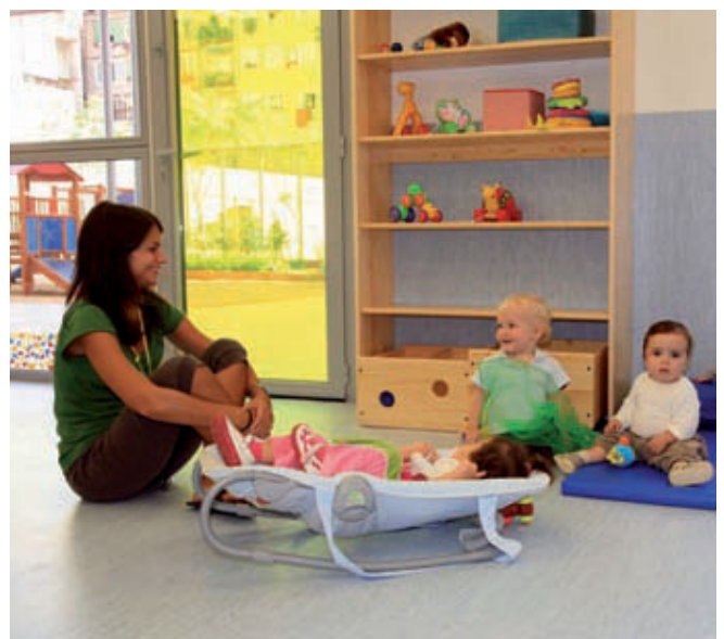
Escola Bressol Municipal La Fassina, a la Sagrada Família.