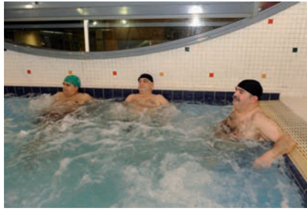
Usuaris d'Aiguajoc en un jacuzzi del centre.

El CEM Aiguajoc Borrell, d'uns 5.000 m 2 , ofereix una àmplia varietat de serveis i d'horaris per millorar la condició física dels usuaris, combinant els espais de piscina,