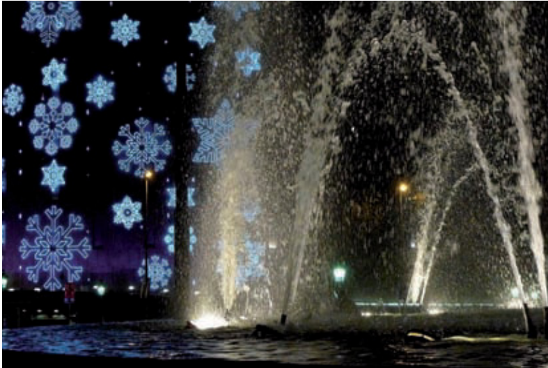
Il·luminació nadalenca a la plaça Catalunya, l'any passat.