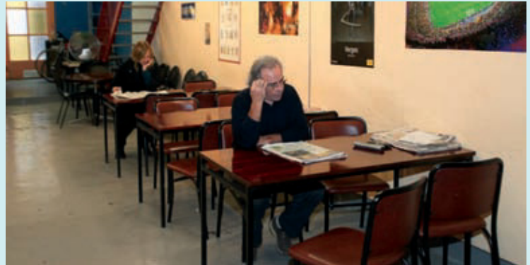
Seu de l'Associació d'Amics del Passatge Lluís Pellicer.