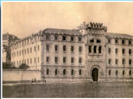
Imatge de la presó Model de Barcelona encara rodejada de camps.

Si té fotografies o documents del seu barri, en pot fer donació a l'Arxiu Municipal del Districte, 93 291 62 28