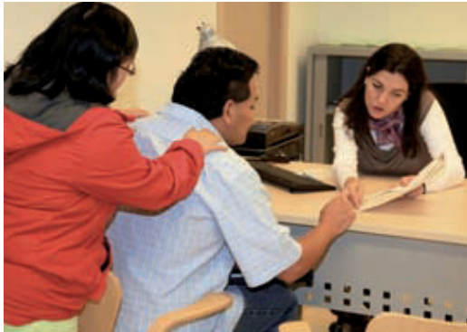
Una treballadora del centre aten dos ciutadans.

Els serveis que ofereix el centre s'adrecen a les persones de manera individual i a col·lectius específics. A més d'informació i orientació i assessorament professional, ja sigui jurídic, so-