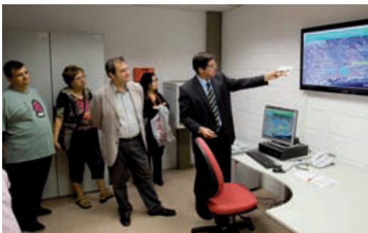
Inauguració del dipòsit, el passat octubre.