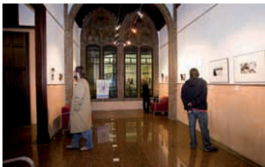
Exposició al centre cívic Casa Golferichs.