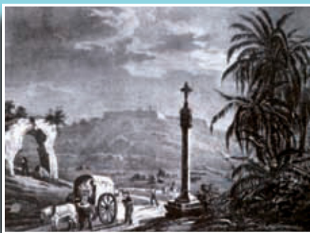
Visió de les rodalies de la Creu Coberta.

Si té fotografies o documents del seu barri, en pot fer donació a l'Arxiu Municipal del Districte, 93 291 62 28