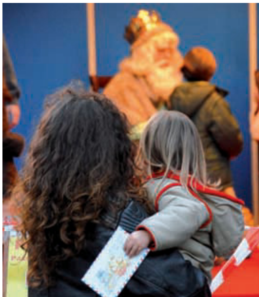
El Rei Melcior, recollint cartes als Encants Nous el 4 de gener del 2009.

A la primera hi ha 118 parades per comprar des d'arbres fins a regals, passant per pessebres o aliments. Està instal·lada fins al 23 de desembre a la plaça Sagrada Família (de 10 a 21 h) i també proposa activitats complementàries com animació infantil i la visita del Pare Noel, que recollirà les cartes dels menuts. A la segona són 293 les parades de joguines, discos i carbó de sucre per als petits que no s'han portat bé, entre les quals quaranta parades d'artesanía escollides amb un concurs del Centre Català d'Artesanía i el Districte de l'Eixample. S'instal·la a la Gran Via (entre Rocafort i Muntaner) i estarà oberta del 18 de desembre al 5 de