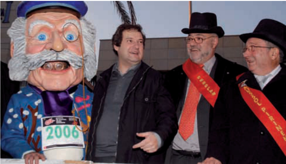
L'Home dels Nassos amb l'alcalde en una edició anterior de la cursa.