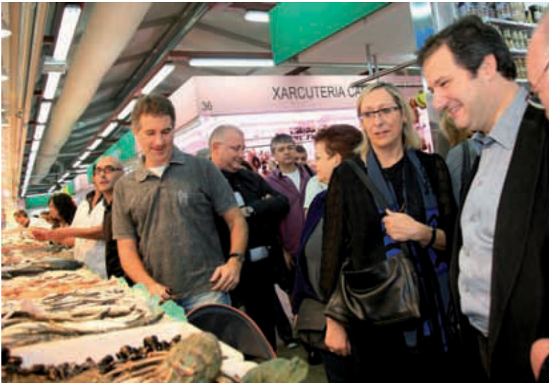
L'alcalde i la regidora durant la inauguració del mercat del Ninot.

Els mercats provisionals de Sant Antoni i del Ninot ja són una realitat. Els veïns se sumen a la inauguració festiva de tots dos espais, els quals albergaran les parades fins que acabi la remodelació total dels mercats originals