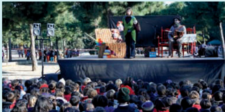
Un dels actes d'una jornada del Camí Amic.

El projecte compartit per les escoles i instituts públics de l'Esquerra de l'Eixample i Sant Antoni treballa també per fomentar valors mediambientals