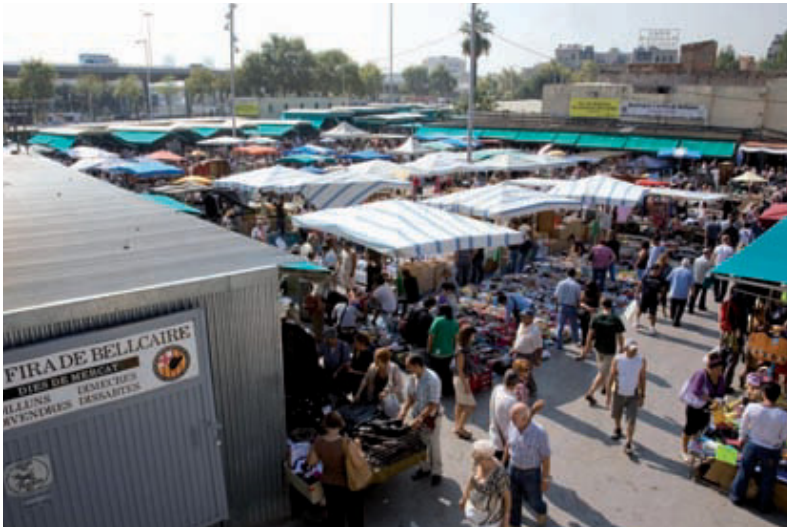
El nou mercat mantindrà la sensació de compra a l'aire lliure que caracteritza els Encants Vells.