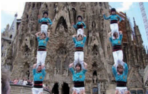
Els Castellers de la Sagrada Família podran assajar a la nova seu.