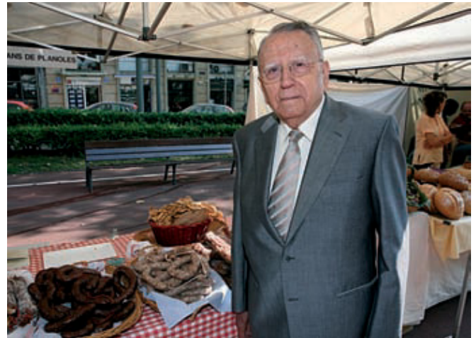
Rovira considera que la diversitat de la ciutat té molt a veure amb la seva gastronomia.

què tinc una senyora que cuina molt bé i m'agrada més lloar la seva cuina. Ara bé, cal puntualitzar que nosaltres som el Club de la Bona Taula, no de la bona cuina. A taula, el que vulguis. És important saber agrair un bon plat.