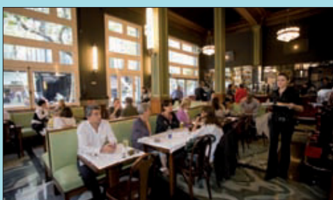
El nou Velódromo respecta l'essència de l'antic bar.

L'emblemàtic bar Velódromo, situat al carrer Muntaner, va tornar a obrir el passat mes de juliol. Els ciutadans podrem gaudir-ne de nou, tant de la seva vessant gastronòmica, a càrrec del prestigiós xef Carles Abellán, com de la lúdica. La restauració duta a terme per Moritz respecta no tan sols l'essència arquitectònica, sinó també el charme del seu ambient i estil. El Bar Velódromo es va inaugurar el 1933. En aquells anys fou centre de tertúlies i reunions polítiques. Durant els anys vuitanta i noranta