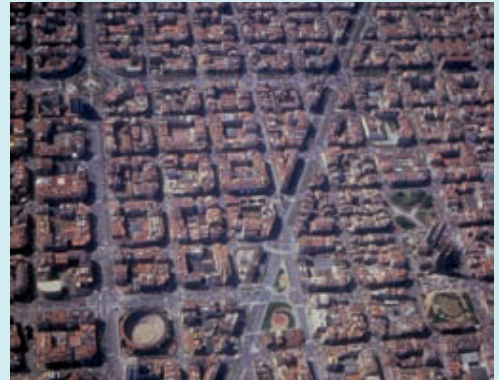
L'actual quadrícula de l'Eixample.