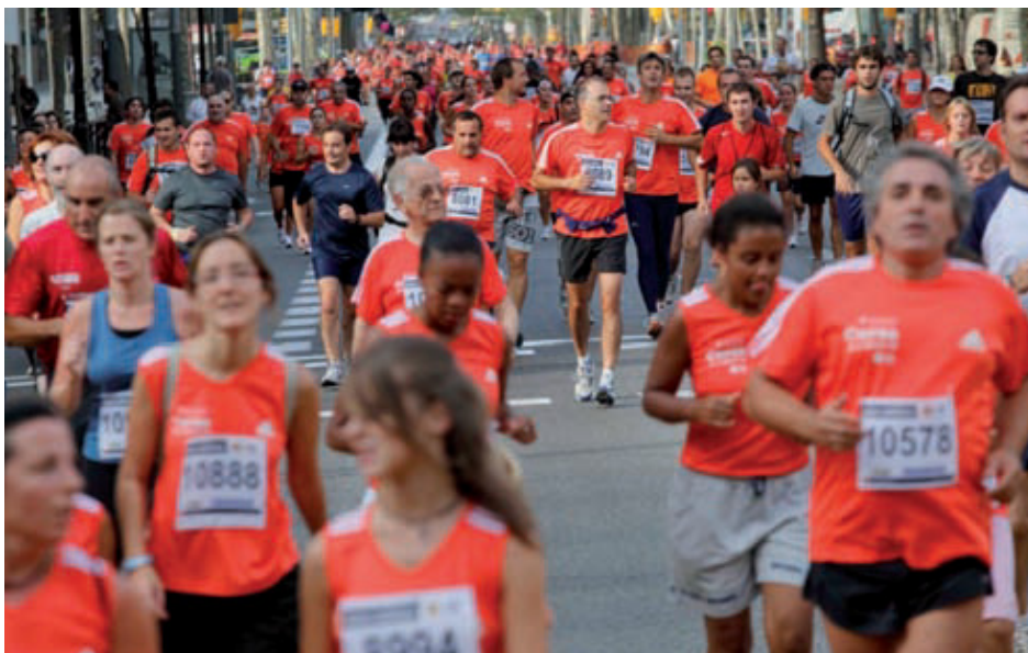
La cursa d'enguany va tornar a ser el tret de sortida de les festes de la Mercè.

La popular prova atlètica, que aquest any compleix la seva trentena edició, continua la tradició de demanar una participació oberta i massiva pels carrers de Barcelona