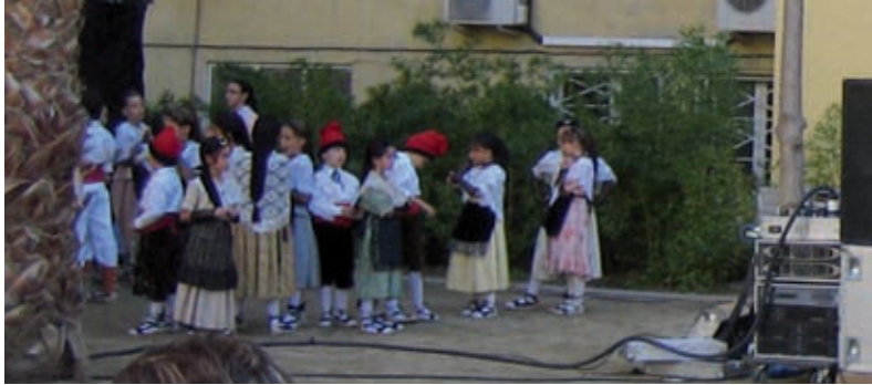
Un dels esbarts dansaires que es va presentar a la darrera edició.

Aquest octubre tothom que vulgui conèixer millor el folklore català té una cita amb "Tardor a l'illa"