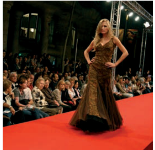
Un moment de la desfilada de l'any passat.

marc de fons, les models desfilaran amb les últimes tendències en moda de dona, perruqueria, pelleteria, joieria, complements i òptica per a aquesta tardor. La diferència amb altres passarel·les professionals és que tot allò que porten les models es troba a les botigues de la Dreta de l'Ei-