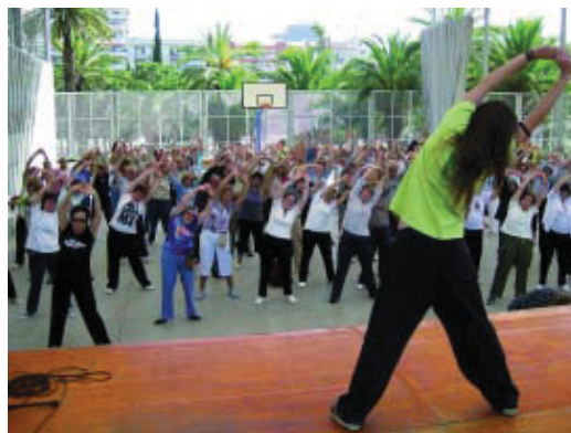
Sessió esportiva per a gent gran celebrada l'any passat al Joan Miró.

Al matí se celebraran activitats esportives de ping-pong, bitlles catalanes, bàdminton, danses d'arreu del món, bicicleta, jocs de Wii i un joc de cloenda. Cada persona podrà participar a dues d'aquestes activitats. Les inscripcions es poden fer als casals i espais