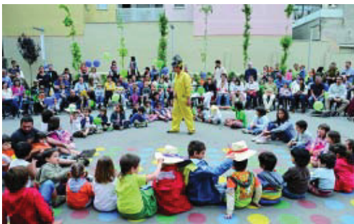
Festa infantil en una adició de l'any passat.