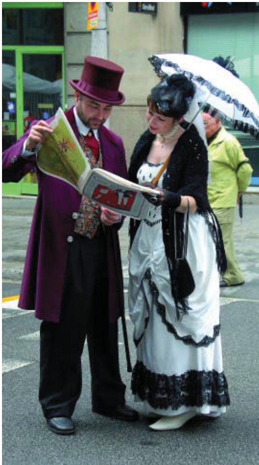
Imatge d'una edició anterior de la Fira Modernista.

tar Ildefons Cerdà i que, per uns dies, recuperarà una autèntica atmosfera del segle XIX. Hi haurà desfílada de cotxes d'època, animació amb actors vestits a la moda del segle XIX, espais infantils amb jocs de simulació i construcció de ciutats, jocs sobre urbanisme, etc. Els centres cívics han organitzat una exposició sobre els mercats als barris, les biblioteques incorporaran un espai de lectura i consulta de documents del pla Cerdà i de disseny urbà, i la Guàrdia Urbana ha ideat