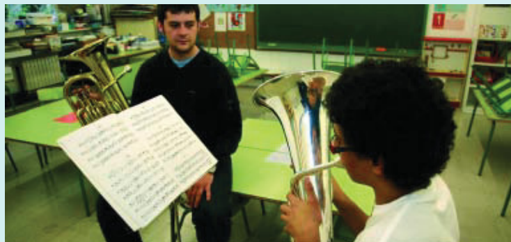
Dos alumnes de l'escola durant un assaig.