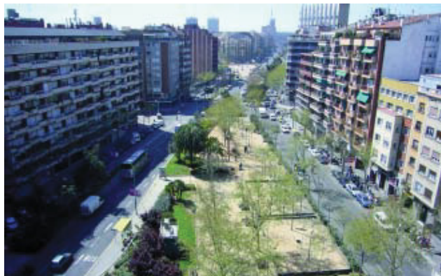
Vista general del tram de l'avinguda que es reformarà.

El Fons Estatal d'Inversió Local finançarà la segona fase de la reforma de l'avinguda Roma, en els 265 metres que hi ha entre els carrers Urgell i Viladomat, que ocupen una superfície de 12.200 m 2 , i que són la continuïtat de la primera reforma que es va fer l'any passat entre Urgell i Casanovas. La idea és convertir aquell tram en zona de vianants, amb més arbrat –hi haurà fins a cinc alineacions d'arbres–, un nou enllumenat, carril bici de doble sentit... El trànsit de la zona experimentarà canvis per guanyar espai per als vianants, per això els vehicles que vagin a Sants des d'Urgell s'hauran de distribuir per Mallorca i Provença.