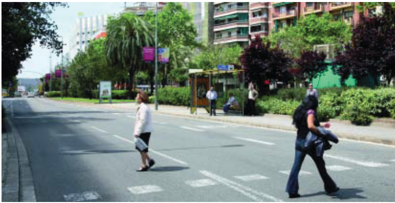
Amb la reforma, al nou tram es guanyarà espai per als vianants.

Amb un cost de 2,6 milions d'euros, aquesta segona fase de la reforma de l'avinguda de Roma forma part dels projectes que es tiren endavant al districte de l'Eixample gràcies al Fons Estatal d'Inversió Local que el govern de José Luis Rodríguez Zapatero ha creat per lluitar contra la crisi econòmica que afecta actualment l'estat.