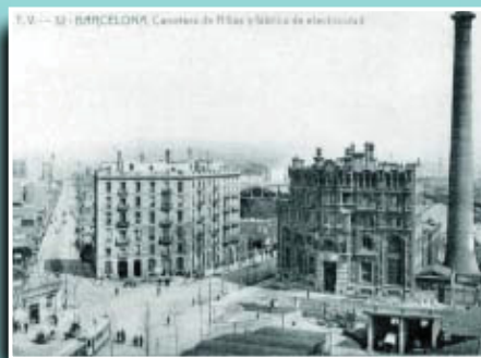
L'antiga carretera de Ribes al seu pas pel barri de Fort Pienc.

Si té fotografies o documents del seu barri, en pot fer donació a l'Arxiu Municipal del Districte, 93 291 68 36