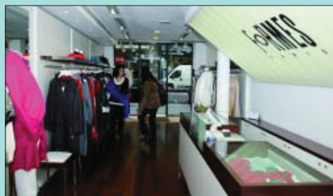
La roba està pensada per a la dona urbana i treballadora.

L'embaràs canvia la silueta de la dona, però la bellesa i l'estil es manté, sobretot si es tria bé com es vesteix. Formes és una firma francesa amb més de vuitanta botigues arreu d'Europa, una de les quals, per sort de moltes dones, és a Barcelona des de fa 9 anys. Tenen roba de gamma mitjana-alta per a la dona embarassada, en un estil pensat principalment per a la dona urbana i treballadora. Hi ha models per a la feina, d'altres de línia més casual o esportiva, per al lleure i caps de setmana, i models