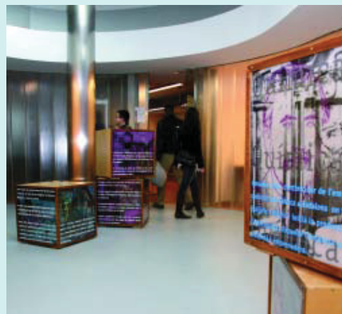
El Tecnoespai disposa d'una sala d'exposicions.