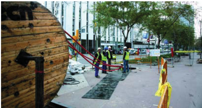
A l'Avinguda Josep Tarradellas hi ha mostres evidents de les obres que s'han començat.

La tuneladora que treballarà en aquest tram serà del tipus EPB, sigles que corresponen a balanç de la pressió de terra . L'EPB injecta pressió al terra mentre el forada, perquè no hi hagi cap moviment, i al mateix temps col·loca les peces de recobriment del túnel. Aquesta tècnica és considerada una de les més avançades i segures per obrir túnels subterranis.