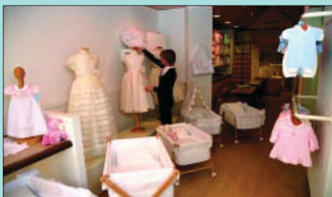
A Mullor disposen de taller de confecció propi.

M ullor és sinònim de distinció en roba per a nadons, embolcalls, jocs de llit, canastreta i altres complements. Com que disposen de taller propi, poden treballar per encàrrec i confeccionar les peces segons les nostres necessitats. També estan especialitzats en bateig i vestits de comunió, tant llargs com curts. A Mullor, hi trobarem moda infantil dels zero als cinc anys, des de la roba més còmoda, de diari, fins a la més elegant. Hi descobrirem sobretot una predilecció