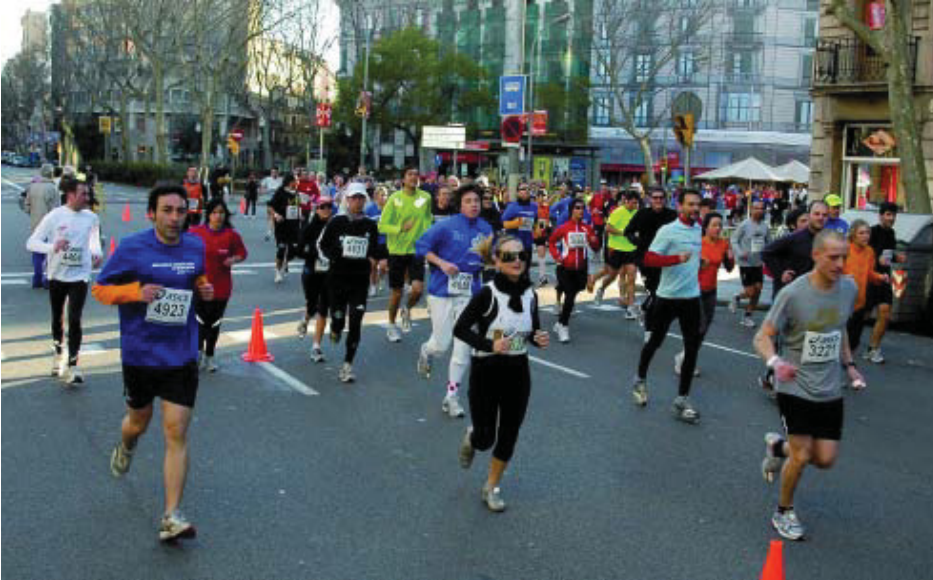
Els participants a la mitja marató, al seu pas per la ronda Sant Pere.