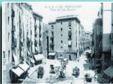
La plaça de Sant Agustí Vell, d'on sortien molts traguers que feien servir la carretera de Ribes.

Si té fotografies o documents del seu barri, en pot fer donació a l'Arxiu Municipal del Districte, 93 291 69 32