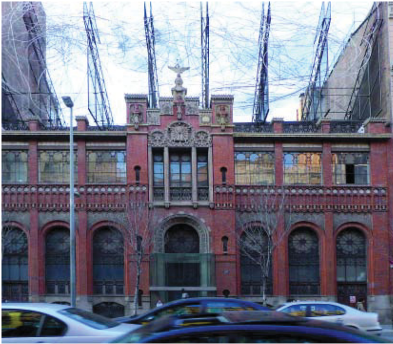
La Fundació Tàpies romandrà tancada fins que acabin les obres.