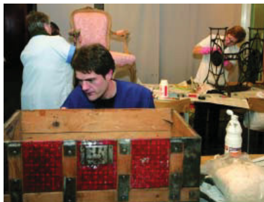
Taller de restauració al centre cívic Sagrada Família.

E ls centres cívics funcionen molt bé al seu barri corresponent, però encara són desconeguts a la ciutat com a veritables centres de proximitat que són; per això, el sector d'Educació, Cultura i Benestar impulsa un projecte per fer més visibles els centres cívics en el conjunt de la ciutat. Per aconseguir-ho, els facilita el seu treball en xarxa, coordinadament amb els districtes. La primera acció és "Barris Creatius. Energia Barcelona". Es tracta d'un projecte on els directores i les directores dels 51 centres cívics de la ciutat treballen per primer cop de manera conjunta i amb els actors implicats per fer de Barcelona una ciutat innovadora, inclusiva i més cívica. Aquests professionals es reuneixen tres o quatre vegades a l'any per desenvolupar accions. Enguany, els 51 responsables han seleccionat cent propostes fetes per les entitats de la ciutat, les quals actualment s'estan