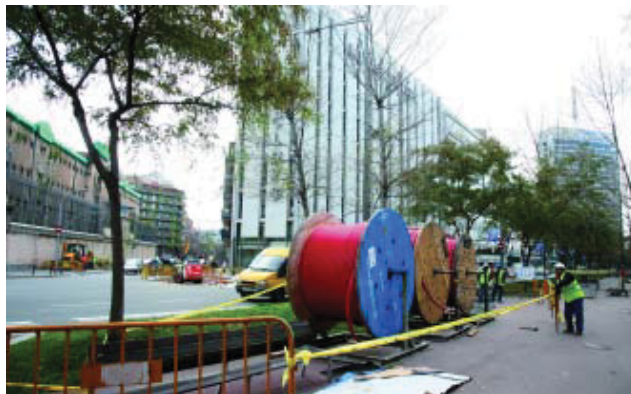
Les obres del carrer Nicaragua vistes des de lavinguda Josep Tarradellas.

La construcció del tram central del tren d'alta velocitat (TAV), que enllaça les estacions de Sants i la Sagrera, ja està en marxa. Adif, entitat pública empresarial depenent del Ministeri de Foment i responsable de les obres, ha iniciat la fase prèvia de desviament de serveis a la cantonada dels carrers Provença i Nicaragua, a prop de l'estació de Sants. Una altra zona de treball serà el carrer Padilla a l'alçada de Mallorca, on es construirà un dels pous de ventilació i sortida d'emergència. La tuneladora que treballarà en aquest tram, del tipus EPB, està considerada una de les tècniques més avançades i segures per obrir túnels subterranis.