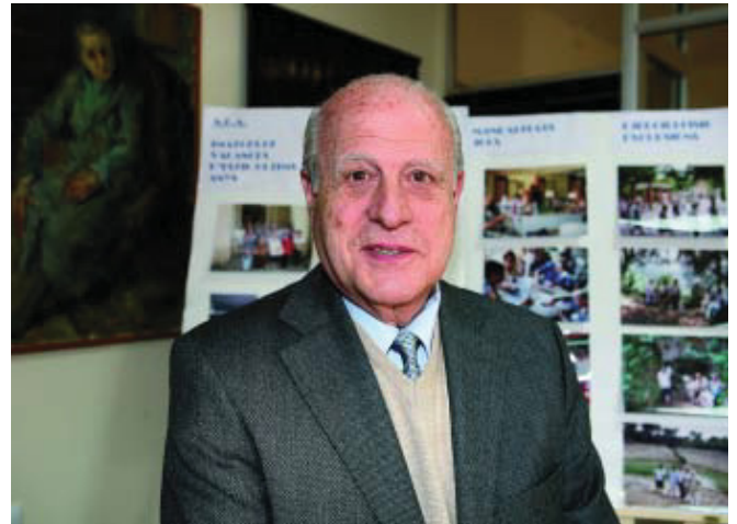
Lluch destaca principalment els problemes econòmics i la mobilitat.

La part econòmica, és evident. Per exemple, quan parlem de les vídues i