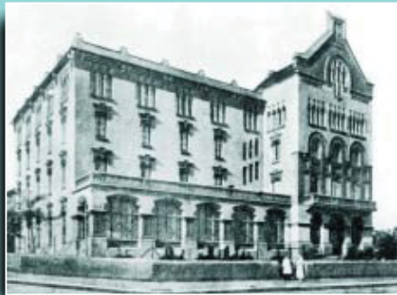
Primer pavelló del Palau de la Mutualitat inaugurat el 1917.

Si té fotografies o documents del seu barri, en pot fer donació a l'Arxiu Municipal del Districte, 93 291 62 28