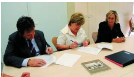
L'alcalde i la presidenta de l'associació de veïns signen el conveni davant la mirada de la regidora del Districte.