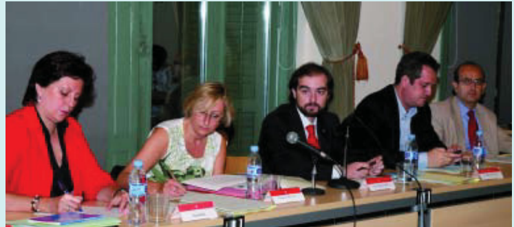
Un moment del Plenari del passat 1 d'octubre.

El programa dóna prioritat a la convivència ciutadana, a la millora de l'espai públic, a la cohesió social i a les polítiques inclusives