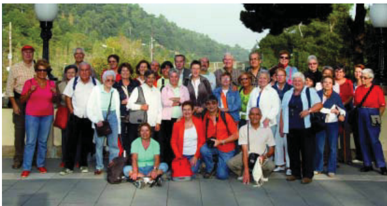
Foto de família dels participants en una de les sortides organitzades pel programa.

El programa de caminades per la ciutat i de senderisme, l'organitzen conjuntament el Districte i la gent gran. La propera caminada serà el dijous 4 de desembre i consistirà en una passejada pels interiors d'illa de l'Antiga Esquerra de l'Eixample. Quant al senderisme, es pot participar en una ruta abans que acabi l'any, la de Sant Medir-Sant Cugat, que es farà dijous 11 de desembre. Totes les activitats d'aquest programa són gratuïtes i per participar-hi només cal tenir més de 60 anys. Es recomana fer la inscripció quinze dies abans de cada activitat. Més informació: Tel. 93 291 62 92 (a partir del 15 de desembre).