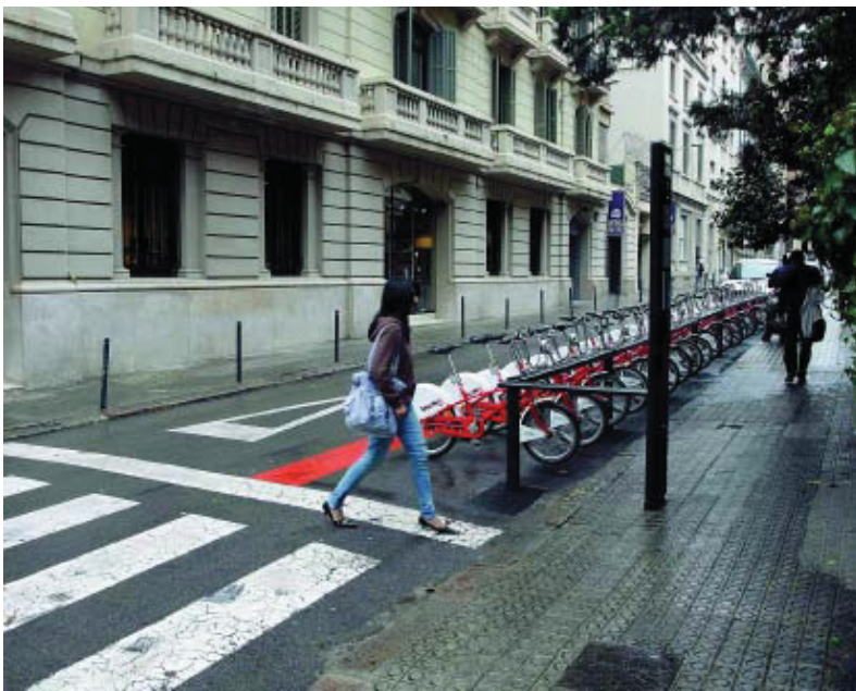
Amb l'ordenació del passatge Mercader es guanyarà espai per als vianants.

Els passatges Domingo, Valeri i Serra, Pagès i Mercader donen prioritat als vianants a l'hora que renoven l'arbrat i el mobiliari urbà