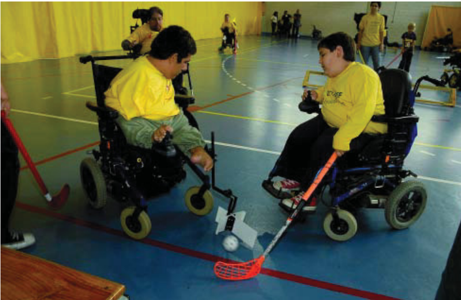
Partit d'hoquei en cadira de rodes.