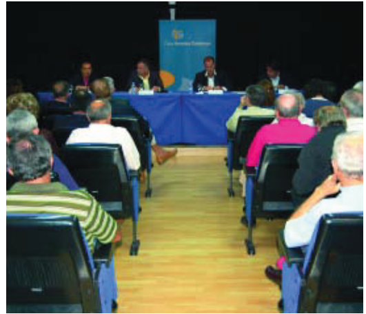
Activitat sobre Cuba a la Casa Amèrica.

La institució també alberga un centre de documentació amb biblioteca, videoteca i arxius documentals. Cada curs gestiona 225 beques per a estudiants d'arreu del món convocades per l'Agència Es-