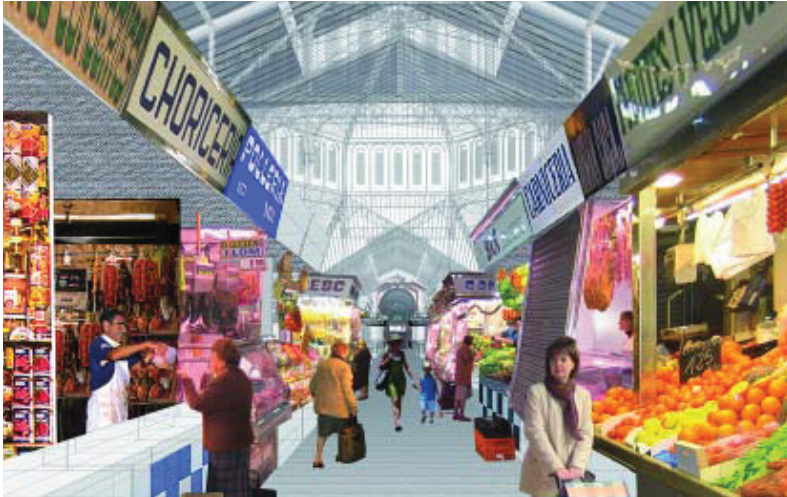
Imatge virtual de com serà l'interior del mercat un cop acabades les obres.

El projecte de reforma del mercat de Sant Antoni preveu rehabilitar l'edifici i alliberar-lo de la tanca que l'envolta, i al mateix temps potenciar els tres mercats –de fresc, dels Encants i dominical– que hi conviuen