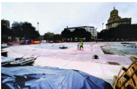
Obres de remodelació del paviment de la plaça de Catalunya.