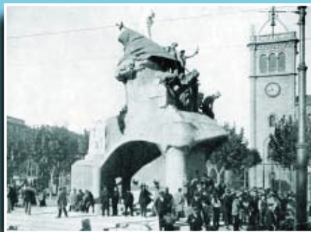
Imatge del monument al Dr. Robert a la plaça Universitat cap a l'any 1920.

Si té fotografies o documents del seu barri, en pot fer donació a l'Arxiu Municipal del Districte, 93 291 62 28