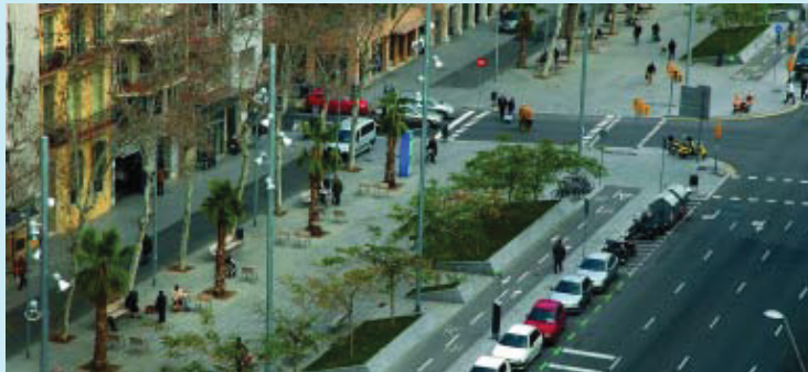
Tram de l'avinguda de Roma ja remodelada.