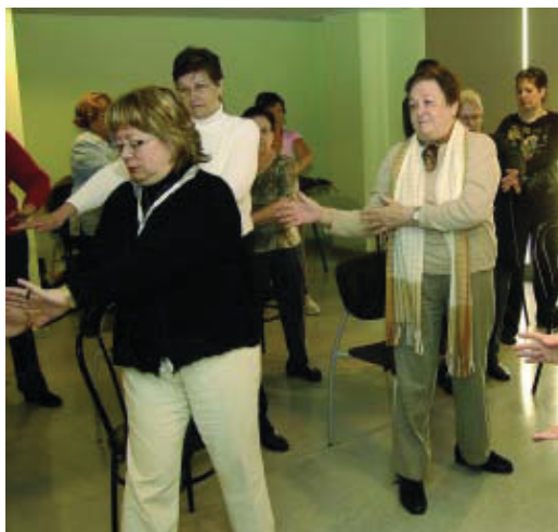
Els tallers d'activitat física són adaptats al ritme de la classe.