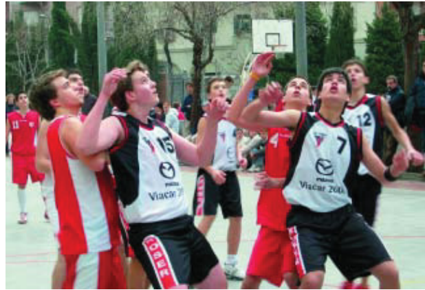
El 80% dels jugadors s'ha format en els equips inferiors.