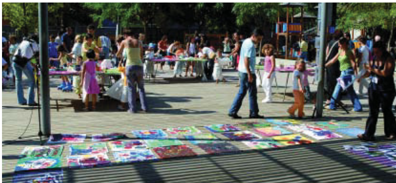
A la festa hi ha activitats per a gent de totes les edats.