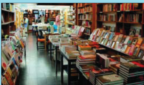
A la Llibreria Ona, tots els llibres són en català.