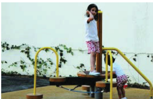
Els nous jardins compten amb jocs infantils.