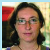
Cristina Pàmies Asseguradora

És molt maca perquè té molt d'espai i està molt ben distribuïda. Feia molta falta al barri.