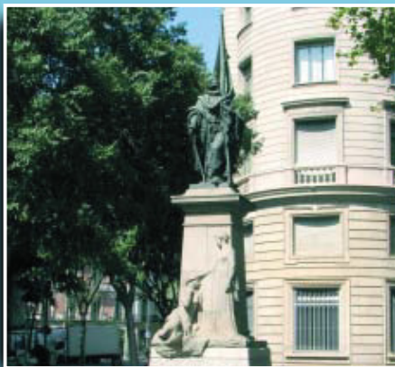
L'estàtua de Rafael Casanova, obra de Rossend Nobas, a la ronda Sant Pere.

Si té fotografies o documents del seu barri, en pot fer donació a l'Arxiu Municipal del Districte, 93 291 62 28