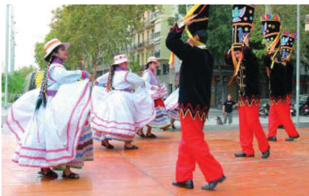
Activitat de la festa major de l'any passat.

Del 28 de setembre al 7 d'octubre, l'Esquerra de l'Eixample celebra la Festa Major. Seran quinze dies farcits d'activitats de tota mena, organitzades per una seixantena d'entitats del barri sota la coordinació de l'Associació de Veïns de l'Esquerra de l'Eixample. Com cada any, no hi faltaran el correfoc, els concerts joves, les activitats infantils, les havaneres amb rom cremat i espectacles de la cultura popular com els castellers i el correfoc. Una de les novetats serà la incorporació a la festa de dos nous espais: l'illa d'Ermesenda de Carcassona i la nova pista poliesportiva coberta del parc Joan Miró.