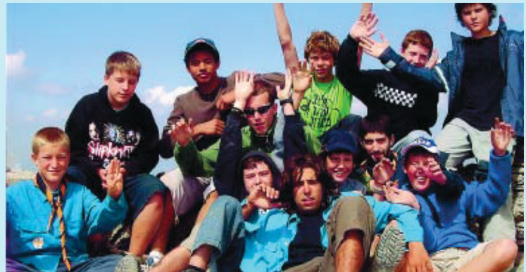
Els actes de celebració dels 25 anys de l'entitat van ser tot un èxit.

L'entitat ha festejat l'aniversari amb un sopar, una excursió i una trobada amb jocs, música, diables i una xocolatada