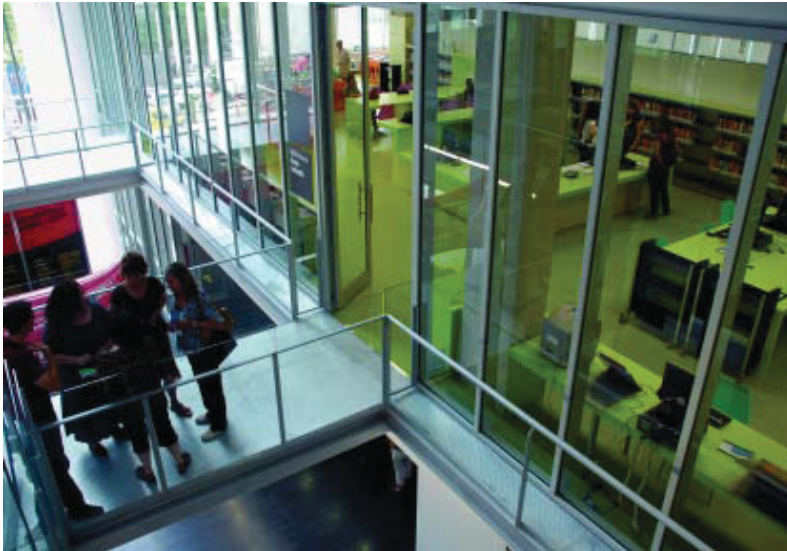
Les quatre plantes de la biblioteca estan connectades per un pati interior que hi fa arribar llum natural.